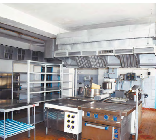
Пищеблок школы № 2.

приятиях обращайтесь внимание на подозрительно ведущих себя людей и предметы, оставленные без присмотра. Не подходите к неизвестным вещам, не пытайтесь самостоятельно узнать их содержимое. В таком случае или в экстренной ситуации вы всегда можете позвонить по телефонам службы экстренного реагирования 112, дежурной части ОМВД по Режевскому району 3-23-61 или 102.