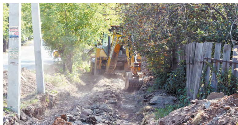
Прокладка удобной пешеходной дорожки.

Несмотря на неудобства, связанные с ограничением передвижения по пешеходным дорожкам сейчас, режевляне ждут новые тротуары и с пониманием относятся к временным преградам на пути.