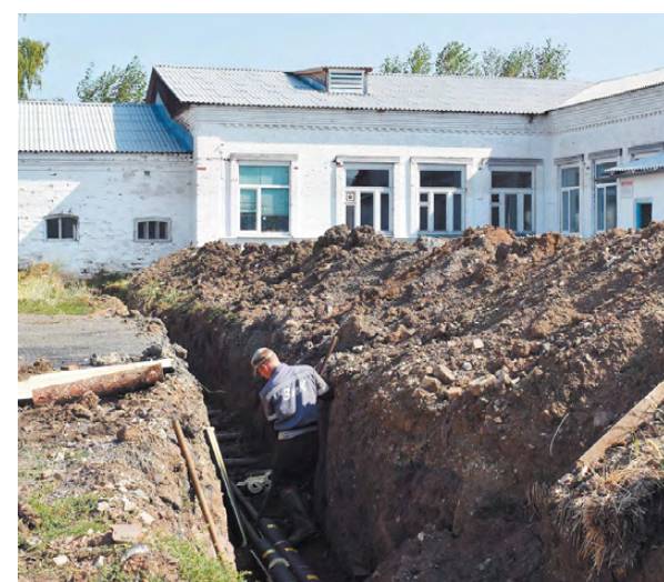
Новая ветка отопления школы.