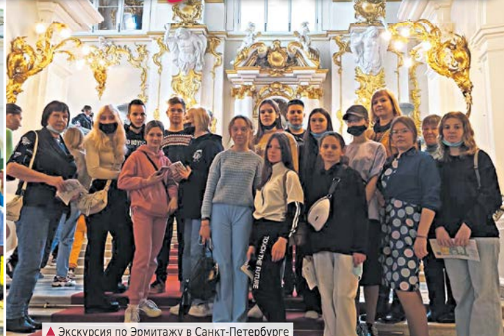
▲ Экскурсия по Эрмитажу в Санкт-Петербурге