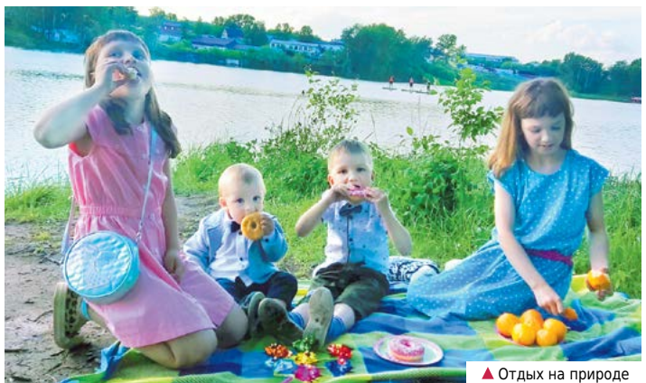
▲ Отдых на природе