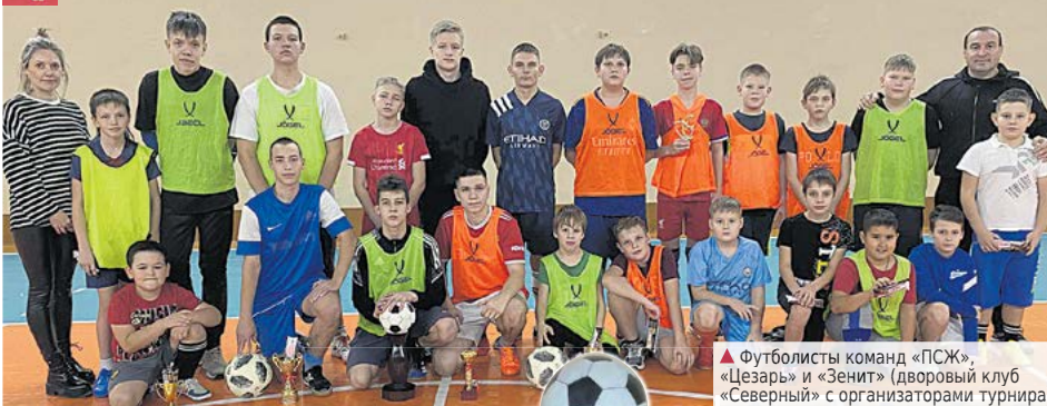
▲ Футболисты команд «ПСЖ», «Цезарь» и «Зенит» (дворовый клуб «Северный» с организаторами турнира