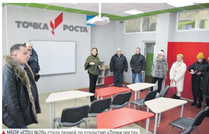
▲ МБОУ «СОШ №20» стала первой по открытию «Точки роста»

Система водоснабжения и водопроводных сетей в Н-Шайтанском долгие годы является самой первостепенной (с 2016 г.). Работы по геологическому изучению недр в поселке были начаты в 2018 году. К середине 2019 года специализированной организацией было изучено 5 пробных скважин, по результатам исследования состава воды которых в разработке осталась всего одна скважина. Результаты геологического изучения недр в 2019 году были переданы ООО «ПАНОРАМА» для использования в работе