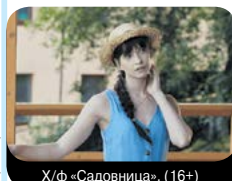
X/ф «Садовница» (16+)