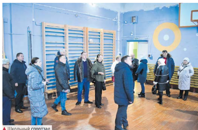
▲ Школьный спортзал