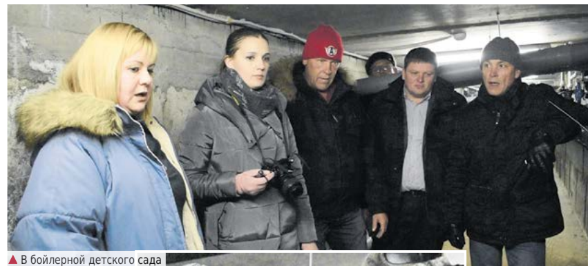
▲ В бойлерной детского сада

по проектированию нового водозабора и сетей в поселке Нейво-Шайтанском. Дважды ООО «ПАНОРАМА» направляло на госэкспертизу подготовленные проектные документы: в октябре 2020 года и в октябре 2021 года. Обе экспертизы получили отрицательное заключение. В конце 2021 года муниципальный контракт с ООО «ПАНОРАМА» был расторгнут, а в мае 2022 года по результатам конкурса был определен новый исполнитель – ООО «ЯРПРОЕКТ». На сегодняшний день ведутся работы по получению лицензии, исследованию воды в скважине и исследованию почвы. Летом 2022