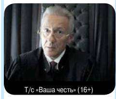
Т/с «Ваша честь» (16+)