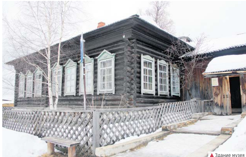
▲ Здание музея