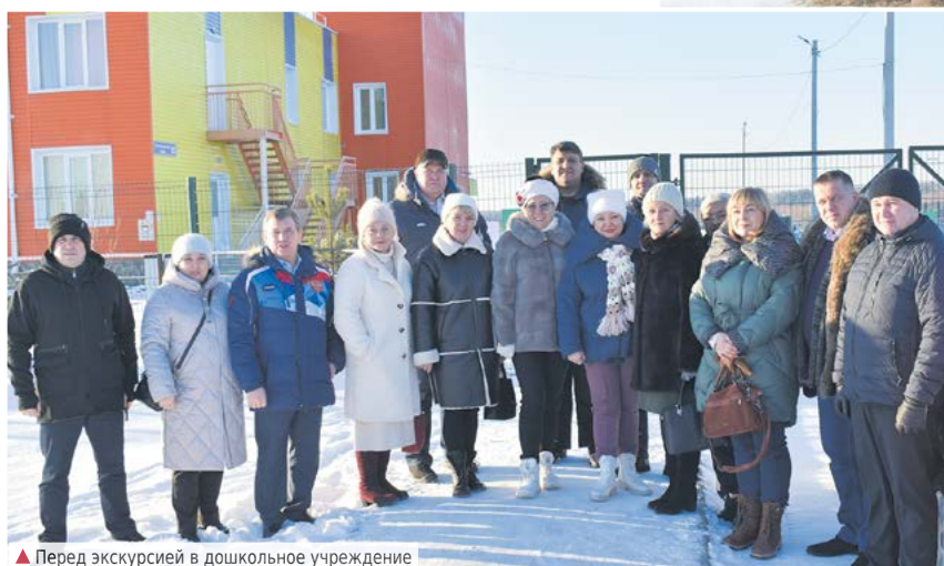
▲ Перед экскурсией в дошкольное учреждение