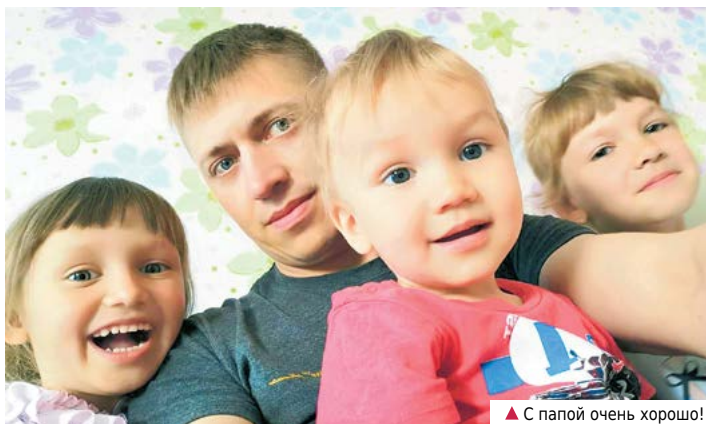
▲ С папой очень хорошо!