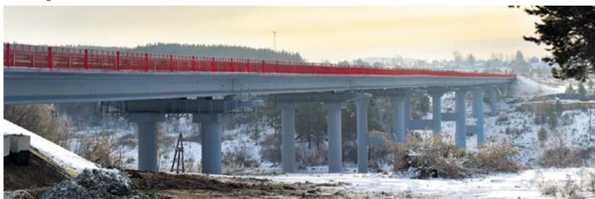
▲ Мост через Нейву

Благодаря губернаторской программе ремонта мостов в Свердловской области в 2022 году отремонтировано более 640 погонных метров искусственных сооружений, связывающих отдаленные территории с «большой землей». Чтобы вывести ремонты мостов на новый уровень, по поручению главы региона была разработана подпрограмма по приведению мостов в малых городах и сельской местности в нормативное состояние.