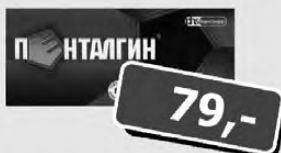
ПЕНТАЛГИН таб. п./об. п 12 с дротаверином

Ждем вас в аптеке «Планета Здоровья» 2 по адресу: