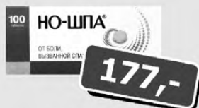
НО-ШПА таб. 40 мг п 100