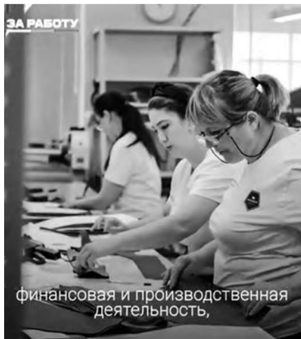
финансовая и производственная деятельность,

в конце сентября пришли к выводу, что проблему нехватки экипировки для мобилизованных и добровольцев нужно решать совместными усилиями.