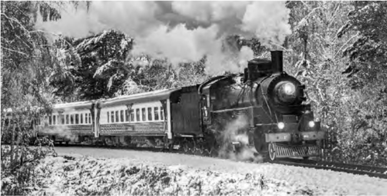
Новый туристический ретропоезд на паровозной тяге «Уральский экспресс» будет курсировать по выходным дням, начиная с 3 декабря, по маршруту Екатеринбург — Шувакиш — Верхняя Пышма Музей. Проект запускает холдинг «РЖД» в рамках развития железнодорожного туризма в России.

Как сообщает пресс-служба холдинга, поездку можно будет совместить с посещением Музея истории, науки и техники СВЖД в Екатеринбурге, в Верхней Пышме — открытой железнодорожной экспозиции, а также музеев военной и автомобильной техники. В составе ретропоезда — вагоны, стилизованные под эпоху начала XX века, вагон-ресторан и вагон-буфет. Продолжительность путешествия в сторону Верхней Пышмы — 1 час 25 минут. В пути пассажиры смогут сделать памятные снимки в специальном фотокупе, воспользоваться аудиогидом. В вагоне-ресторане можно будет попробовать традиционные блюда уральской кухни. На отрезке от Екатеринбурга до станции Шувакиш экспресс поведет легендарный пассажирский электровоз ЧС2, в народе известный как «Чебурашка». На станции Шувакиш, где начинается неэлектрифицированный участок пути, к поезду будет прицеплен паровоз, чтобы дальше состав следовал на паровой тяге. Туристы смогут понаблюдать за работой локомотивной бригады. На станции возведено здание вокзала в историческом стиле с пассажирской платформой. В здании вокзала Шувакиш можно будет почувствовать атмосферу конца XIX — начала XX