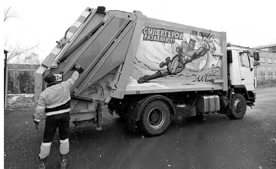
Коммунальный супермен призывает челябинцев не выбрасывать пластик вместе с остальными отходами.

В Челябинске вышли в рейс мусоровозы, на бортах которых вместо привычных в преддверии новогодних каникул Деда Мороза и Снегурочки появилось изображение супергероя из комиксов, предлагающего вместе с ним спасти планету от пластика. Идея создания «коммунального супермена» принадлежит регоператору по обращению с ТКО — предприятию «Центр коммунального сервиса» (ЦКС). С начала года ЦКС установил в Челябинске и пригородах более 400 отдельных контейнеров для сбора пластиковой тары.