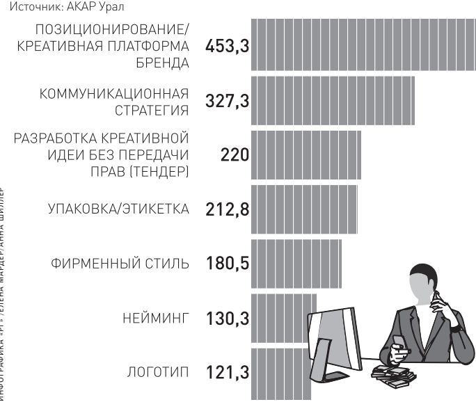
ИНФОГРАФИКА: ИТ - ЕЛЕНА МАКРЕВАННА ШИЛЛЕР