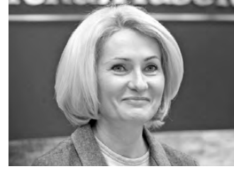
Виктория Абрамченко, вице-премьер правительства РФ

—Мероприятия региона по переходу на экологически чистые технологии и современное оборудование позволяют достичь лучших показателей снижения вредных выбросов, чем планировалось. Поэтому в комплексные планы Челябинска и Магнитогорска, которые реализуются в рамках федерального проекта «Чистый воздух», внесены существенные коррективы, и, я уверена, новые показатели будут с успехом выполнены.