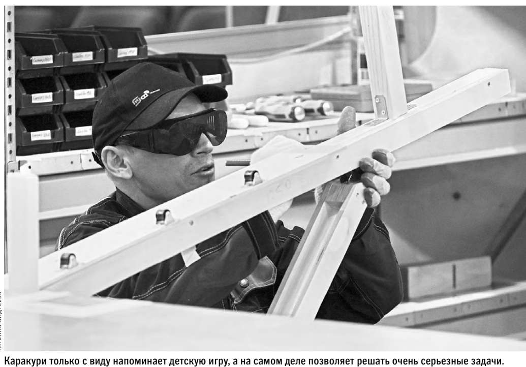
Каракури только с виду напоминает детскую игру, а на самом деле позволяет решать очень серьезные задачи.

То есть если проследить за закономерностями: чем больше женщин уходит в мужские профессии, тем меньше рождается детей. И хотя в современных условиях гендерное разделение труда постепенно исчезает, все же естественный труд все чаще автоматизируется, но все еще остаются сферы, куда женщинам лучше не допускать. Не потому, что не справятся, а просто чтобы беречь. Гострудеинспекция привела цифры: за три последних года в результате несчастных случаев на производстве в Курганской области пострадало 24 женщины, 11 из них погибли. Чаще всего работницы травмируются во время падения с высоты, например с крана.