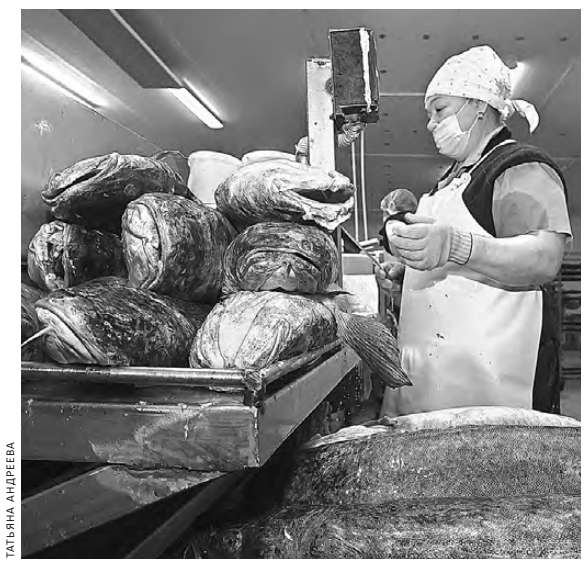
Есть отрасли, где в основном работают женщины. И дело не в том, что труд там легкий, просто платят мало.

Кстати, насчет «взяли и понесли». Хотя женщины и претендуют на равную зарплату с мужчинами, физически они объективно слабее, поэтому для них требуются особые условия труда. Раньше для них вообще существовал отдельный СанПиН, теперь его нет. Да и некоторые другие пункты трудового законодательства начали пересматривать. Не так давно Минтруд РФ утвердил новые предельные нормы нагрузок для женщин при подъеме и перемещении тяжестей вручную. На первый взгляд, он мало изменился: дамам разрешено перемещать с рабочей поверхности максимум 350 килограммов за смену, с пола — 175. Но раньше ограничивали расстояние перемещения тяжести — за смену не более чем на пять метров, теперь эту норму просто убрали: можно впрягаться лань в тележку и возить на ней грузы. Вполне законно.