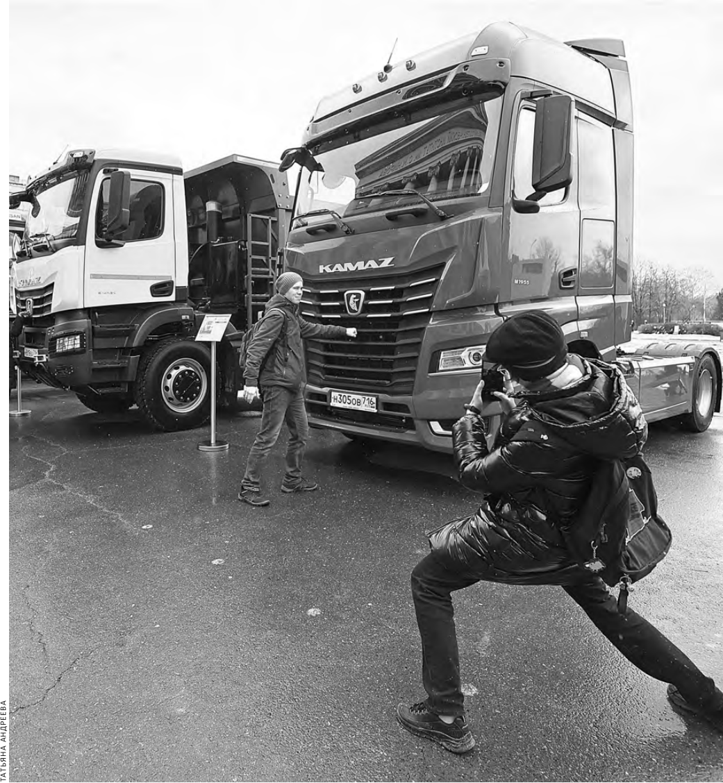
Современный грузовой автомобиль выглядит очень привлекательно — многие хотели сфотографироваться на его фоне.