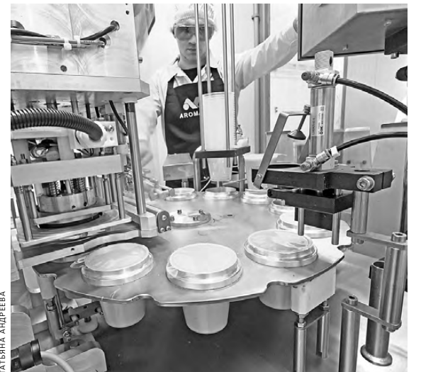
В оборудовании производитель вложил около 14 миллионов рублей.

— Мы вложили в ремонт помещения около 3,5 миллионов рублей, купили оборудование примерно на 14 миллионов. Куттер изготовлен в Барнауле, автоклавы и упаковочное оборудование — в Челябинске. Установленные на сегодняшний день мощности позволяют выпускать около 200 тонн супов в месяц, около 150 тонн крем-пасты и около 100 тонн готовых вторых блюд в реторт-пакетах, — рассказывает управляющая Уральской агропромышленной группой Ирина Макарова.