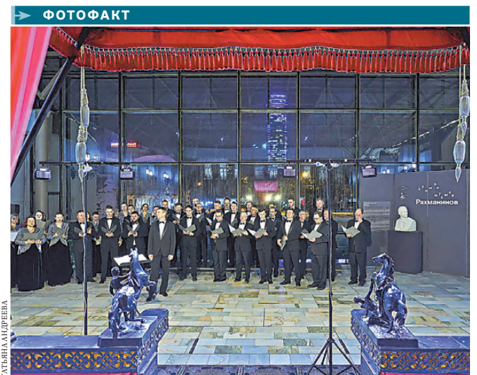
Выступлением симфонического хора в зале главного здания Екатеринбургского музея изобразительных искусств Свердловская филармония презентовала программу музыкального фестиваля к 150-летию Сергея Рахманинова. Само мероприятие пройдет весной, но город и зрители начинают готовить уже сейчас. Фестиваль назван «Рахманинов. Зримая музыка», и творения композитора приобретут визуальную составляющую благодаря видеопроекции картин известных живописцев рубежа XX века.