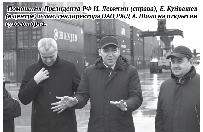
Помощник Президента РФ И. Левитин (справа), Е. Куйвашев (в центре) и зам. гендиректора ОАО РЖД А. Шило на открытии сухого порта.

Мультимодальный транспортно-логистический центр расположен на площади более 130 гектаров в непосредственной близости от ключевых транспортных магистралей. Ожидается, что гру-