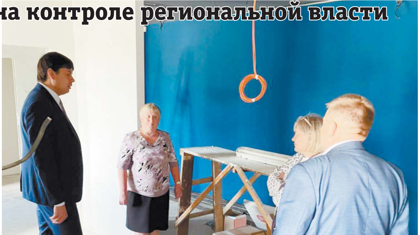
В почтовом отделении с. Клевакинского.

Клевакинцы с нетерпением ждут, когда в селе появится современно оборудованное отделение почты.