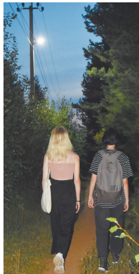
По освещенной тропе прогуливаться – одно удовольствие.