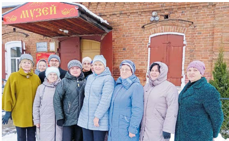
▲ Гости музея

О том, что в Арамашево действует прекрасный краеведческий музей, каждый из нас, алапаевцев, конечно, слышал. Но увидеть самим – совсем другое дело!