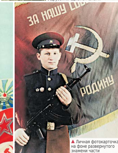
▲ Личная фотокарточка на фоне развернутого знамени части