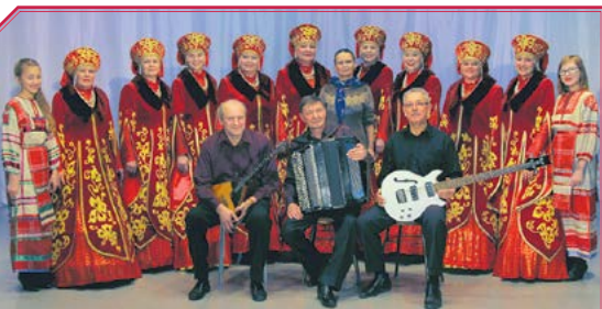
▲ Ансамбль народной песни «Горенка»