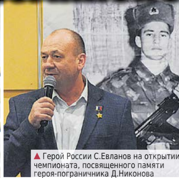
▲ Герой России С.Евланов на открытии чемпионата, посвященного памяти героя-пограничника Д.Никонова