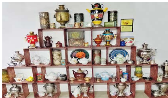
▲ Выставка самоваров и чайников

Но Арамашево известно не только краеведческим музеем, а знаменито на весь регион своей церковью, капитально отреставрированной в 2011 году. Эта церковь – настоящая духовная связь времен и поколений нашей малой родины и Отечества. Ее архитектура неповторима, а духовная значимость – не-