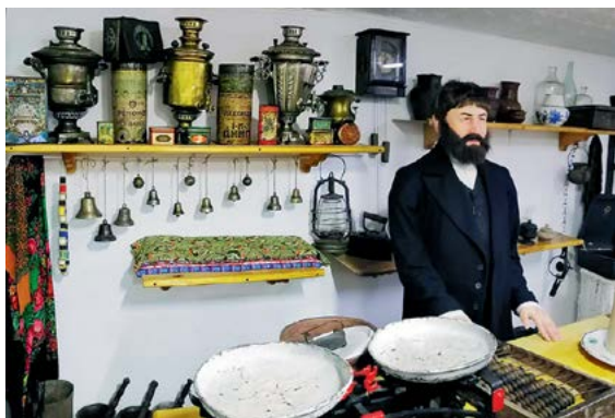
▲ В гостях у купца

Нина ПЕРЕВОЗЧИКОВА