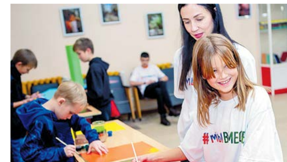
▲ Совместное творчество

«Весенняя неделя добра», раздача георгиевских ленточек, «Всероссийский день заботы о памятниках истории и культуры», мероприятия ко Дню пионерии, участие в акциях «Безопасность жизни», «Стань заметной на дороге», «День борьбы с терроризмом», участие в Царских днях и Елизаветинской ярмарке, в конкурсе авторских стихов, «Ночи искусств и музеев»... Это лишь малый перечень мероприятий в портфолио алапаевских добровольцев культуры, которые они смогли организовать и воплотить в жизнь за 7 месяцев. Все это время, находясь почти всегда за кулисами творческой жизни, они выполняли невидимую, казалось бы, работу, которая неизменно была направлена на сохранение культурных традиций и ценностей.