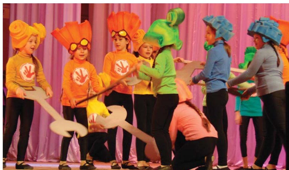
«Фиксики» мультяшные, как будто настоящие.

- В детстве я сама занималась здесь, во Дворце, в студии эстрадно-спортивного танца. Шесть лет назад организовала свою студию танцевальной аэробики для взрос-