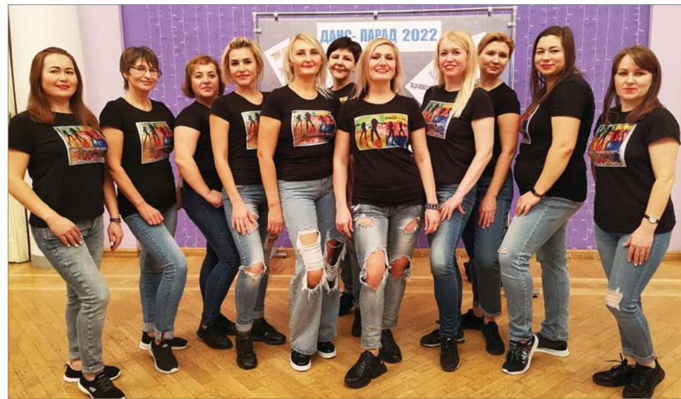
Участницы «Dance Fitness»: после фестиваля — на тренировку!