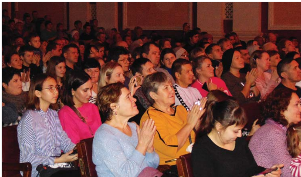
В зале – аншлаг!