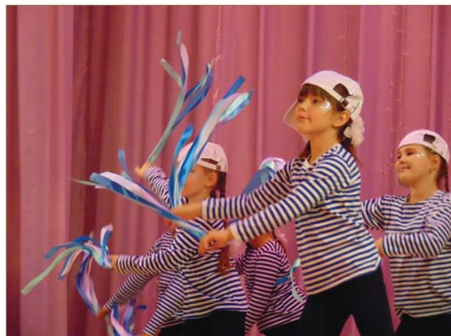
Морской флэш-моб от фитнес-студии «Радуга».

69 и 27, задорно сплясавшие кадрили и эстрадный танец.