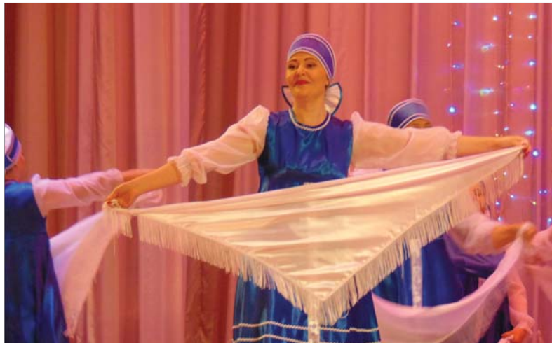
«Белый лебедь» сорвал аплодисменты.

Самым младшим танцорам на «Данс-параде» было по 5 и 6 лет. Это малыши студии эстрадно-балетного танца «Фиеста+» в образе гномиков, дошколята из детских садов