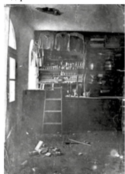
помещение магазина «Торгсин» на момент осмотра места происшествия, 14.05.1934 года