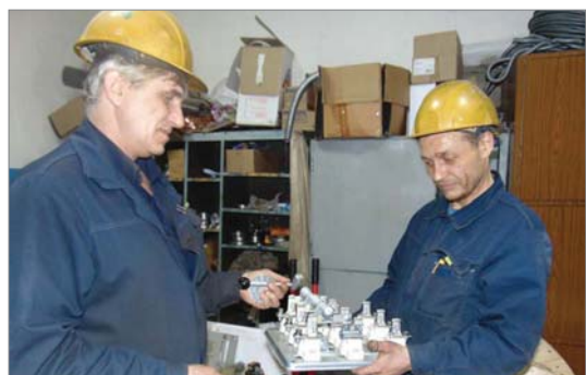
2023-й по Указу президента России объявлен Годом педагога и наставника.