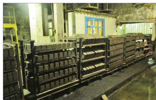
Во втором огнеупорном цехе сохраняется высокая загрузка по динасовому ассортименту.