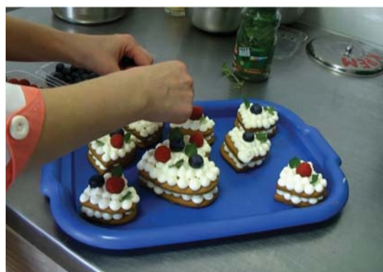
Пирог, хлеб, печенье, торты – от заводских кондитеров.