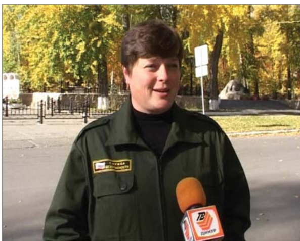
2010 год. Рассказывает о городском турслёте.