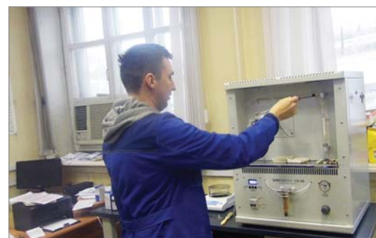
В заводской центральной лаборатории – новый газоанализатор.