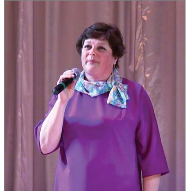
2017 год. На заводском фестивале.