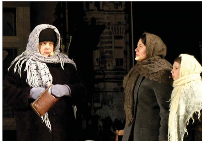
2021 год. В спектакле «Ленинградцы» (слева).