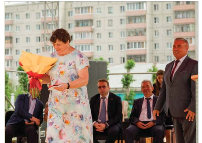
2022 год. Награждена знаком «За активную работу в профгруппе».