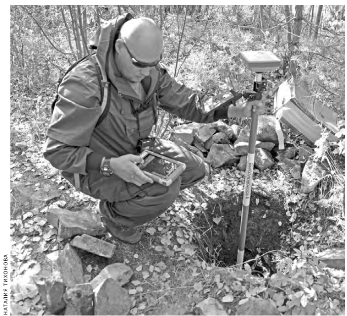
«Каменная клумба» в Шарташском лесопарке, которую геодезисты проверяли в августе, на самом деле часть важной геосети.

Система пространственных данных принесет пользу только тогда, когда информация, которой ее наполнят, будет полной, достоверной, неповторяющейся и непротиворечивой. К сожалению, сейчас это не всегда так. Кроме того, суды по-разному трактуют, что первично при определении границ: ЕГРН или генплан с правилами землепользования и застройки. Поэтому не исключены казусы: начали, например, прокладывать дорогу и обнаружив, что по маршруту стоят объекты, которые снести нельзя, только обходить.