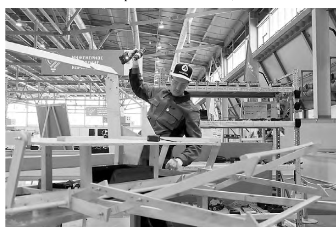
Каракури—термин из японского языка, означает простейшие устройства для механизации ручного труда. Это только кажется элементарным, известны случаи, когда каракури заменяли роботов и экономили миллионы рублей.

Все они поделены на восемь направлений: инженерное мышление каракури, изобретательские задачи, бережливые технологии на железнодорожной станции, цифровизация производства, коллаборативные роботы, фабрика процессов, организация серийного выпуска изделий. Кроме того, команды соревнуются в питч-сессии стартапов.