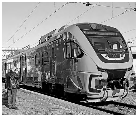
Современный дизель-поезд оборудован всем необходимым для маломобильных пассажиров.

С 11 ноября между Челябинском и Екатеринбургом начнет курсировать поезд «Орлан». Он будет ежедневно отправляться из Челябинска в 06.50, обратно — в 18.07. Время в пути составит 3,5 часа с остановками на платформе «236 километр», Аргаяш, Кыштым, Верхний Уфалей, Полевая и Первомайская, отметили в управлении ЮУЖД. «Орлан» — современный дизель-поезд, оборудованный климатической установкой, мягкими сиденьями, санитарными модулями и всем необходимым для маломобильных пассажиров.