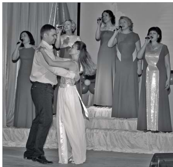
● Ансамбль «Элегия»