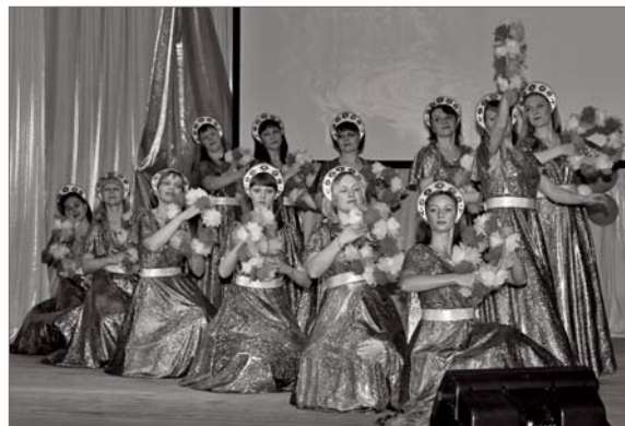
● Танцевальный коллектив «Солнышко»