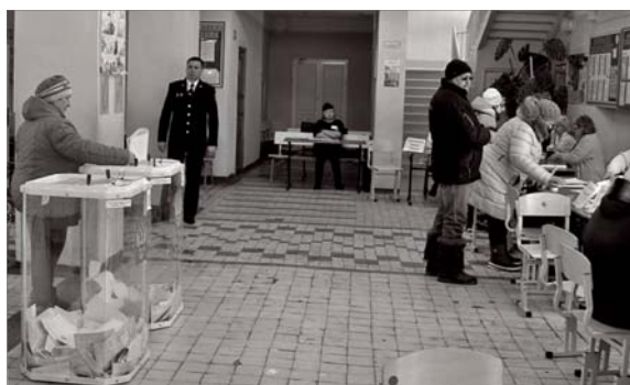
● На избирательном участке

Бисертская поселковая территориальная избирательная комиссия.