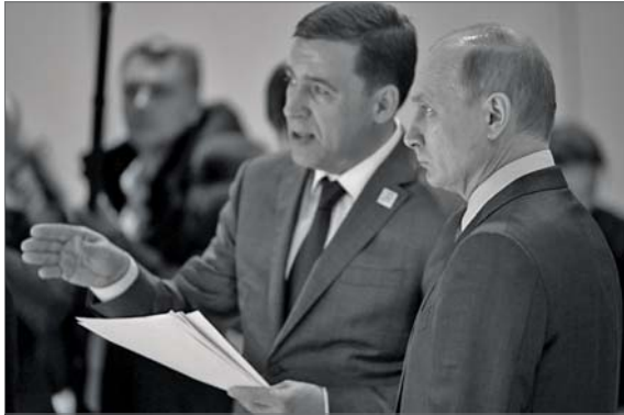
● Евгений Куйвашев ознакомил Владимира Путина с концепцией «умного города»

Встреча с рабочей молодёжью продолжалась более часа - Президент спрашивали и о возможности привлечения инвестиций в города, об условиях получения высшего образования для рабочей молодёжи, в том числе и о целевых наборах; важное место в разговоре Владимира Путина и молодых тагильчан заняли вопросы экологии и качества воды. Как отметил Президент, в соответствии с федеральным законодательством, с 2019 года 300 предприятий вынуждены будут перейти на более современ-