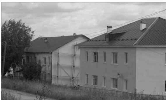
● Дома, отремонтированные по программе «Капитального ремонта общего имущества в многоквартирных домах Свердловской области». 2016 год

общего имущества в многоквартирных домах Свердловской области», в домах Бисертского городского округа за 2015-2017 годы был проведен капитальный ремонт в 12 многоквартирных домов . В 2018 году капитальный ремонт будет проведен в многоквартирном доме по Революции, 5.