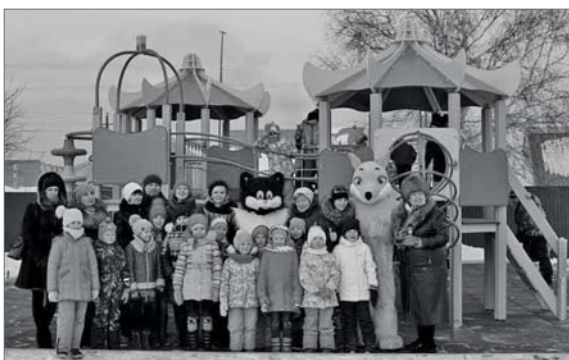
● Детская игровая площадка в Центральном парке культуры и отдыха поселка Бисерть, построенная по программе «Комфортная городская среда». 2017 год