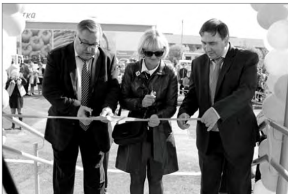
● Новоселье в доме, построенном по программе переселения граждан из аварийного жилищного фонда. 2015 год

Это и инфраструктурные вопросы. Так, при активной поддержке министра ЖКХ в Бисерти в августе 2016 года закончено строительство наружных сетей холодного водоснабжения (улицы Октябрьская - Пушкина - Луговая). Строительство этого важного объекта осуществлялось благодаря тому, что Бисерти удалось попасть в государственную программу Свердловской области «Развитие жилищно-коммунального хозяйства и повышению энергетической эффективности». А в рамках реализации «Региональной программы капитального ремонта