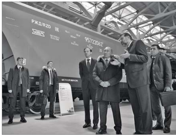
● Владимир Путин ознакомился с последними разработками предприятия УВЗ

Губернатор Евгений Куйвашев 6 марта ознакомил Президента РФ Владимира Путина с концепцией «умного города», который будет построен в Екатеринбурге для проведения в 2025 году Всемирной универсальной выставки ЭКСПО. Владимиру Путину, в частности, показали первые проекты павильонов будущей выставки, проект круговой монорельсовой дороги, которая пройдет над водным пространством близ площадки «Экспо», и другие концепции развития территории. Губернатор рассказал главе государства о том, какие колоссальные преобразования