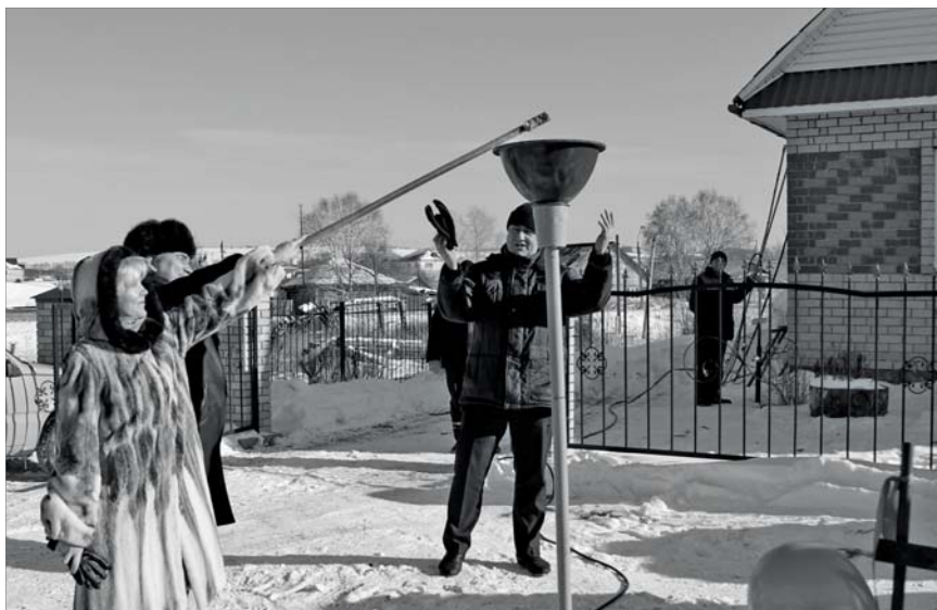
● 13 марта: торжественная церемония пуска газа на втором участке газификации (улицы Красноармейская, 1-я Ключевая, Ленина, Речная)

В этом плане радует, что за последние годы Бисерть стала местом частых визитов и объектом пристального внимания должностных лиц регионального масштаба - так, за последние годы в Бисертский городской округ с разной степенью периодичности приезжали: заместитель Губернатора Свердловской области - Азат Салихов, министр образования Свердловской области - Юрий Биктуганов, министр промышленности и науки Свердловской области - Сергей Пересторонин, министр социальной политики Свердловской области -