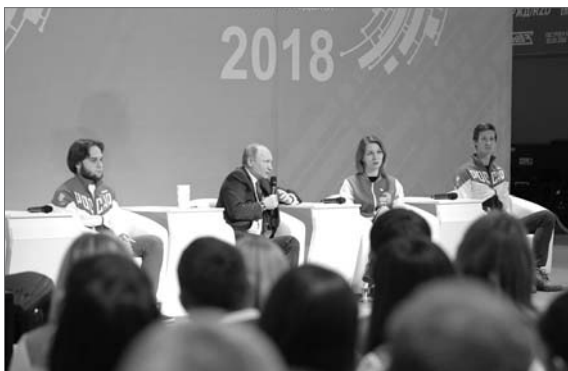
● Владимир Путин принял участие в Шестом Всероссийском форуме рабочей молодёжи, который собрал более трёхсот делегатов из 38 регионов России

ждет территория в 555 гектаров на берегу Верх-Исетского пруда. Глава государства пожелал успеха заявке Екатеринбурга на проведение выставки.