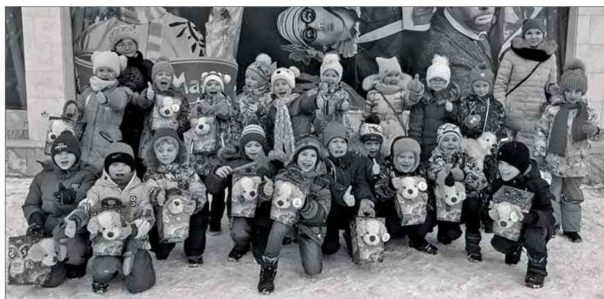
● У Екатеринбургского цирка

КРОМЕ ТОГО, накануне Нового 2018-го года бисертские первоклашки из школы №1 посетили представление «Тайна новогодней звезды» в Екатеринбургском цирке, после которого юным бисертцам были ещё и вручены подарки: сладости и мягкие игрушки с символом наступившего года.