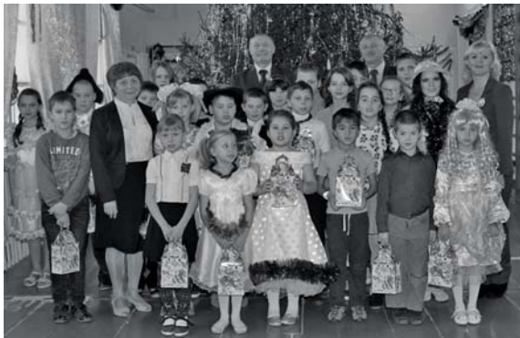
● Новогодняя елка в Киргишанах