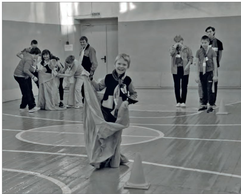
● Весёлые старты: бег в мешках