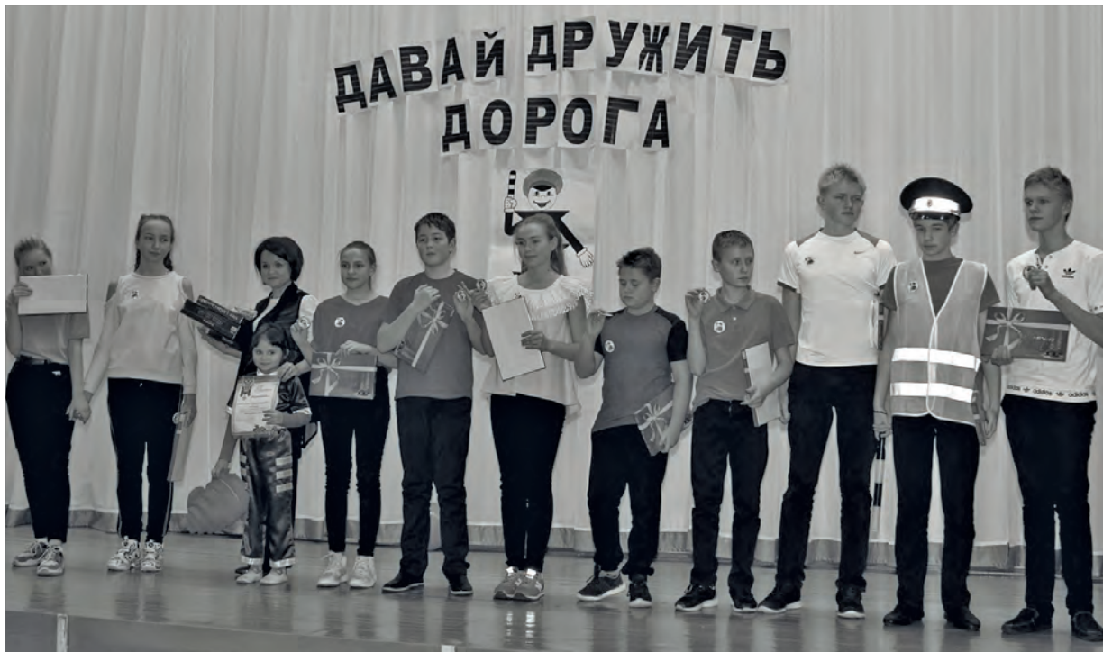
● Команда школы № 2 посёлка Бисерть

На базе школы №1 посёлка Бисерть 14 декабря прошёл городской конкурс отрядов Юных инспекторов движения.