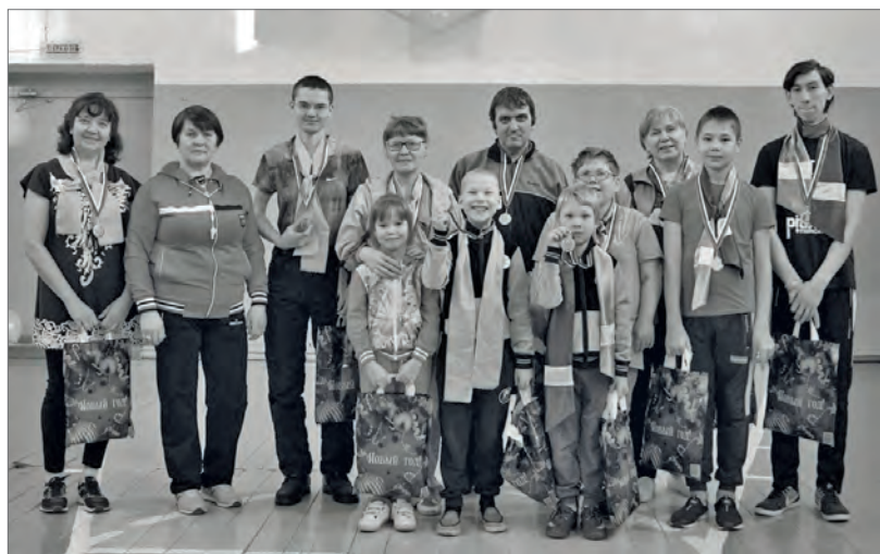
● Фото на память