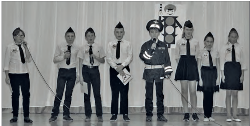
● Команда школы села Киргишаны