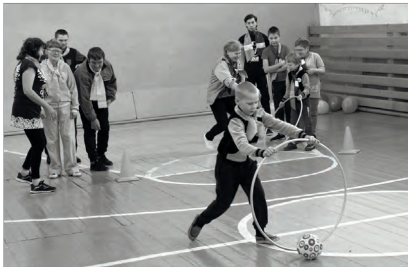
● Весёлые старты: докати мяч