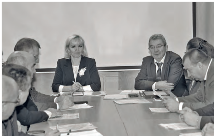
● Совет глав состоялся в читальном зале поселковой библиотеки