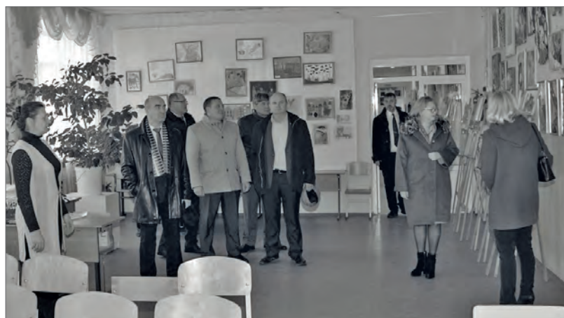
● В Детской школе искусств гости посмотрели выставку работ учащихся

муниципальных служащих. Отличившимся главам были вручены благодарственные грамоты Губернатора и Заксобрания Свердловской области.