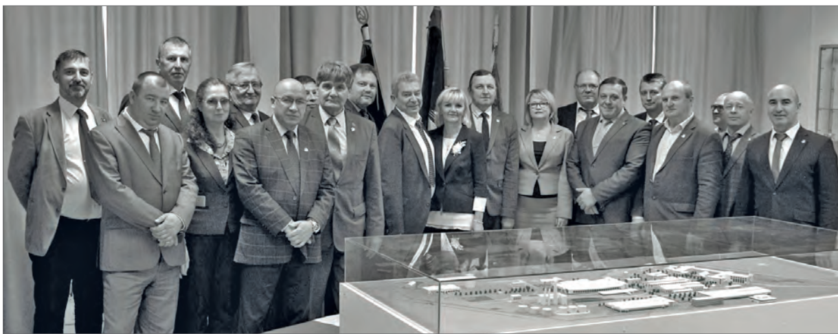
● Фото на память в музее Бисертского городского округа

ВДАЛЕКОМ 1995-м году, тогдашним губернатором - Эдуардом Росселем, был издан указ о создании в Свердловской области пяти управленческих округов - Восточного, Западного, Горно-заводского, Северного и Южного.