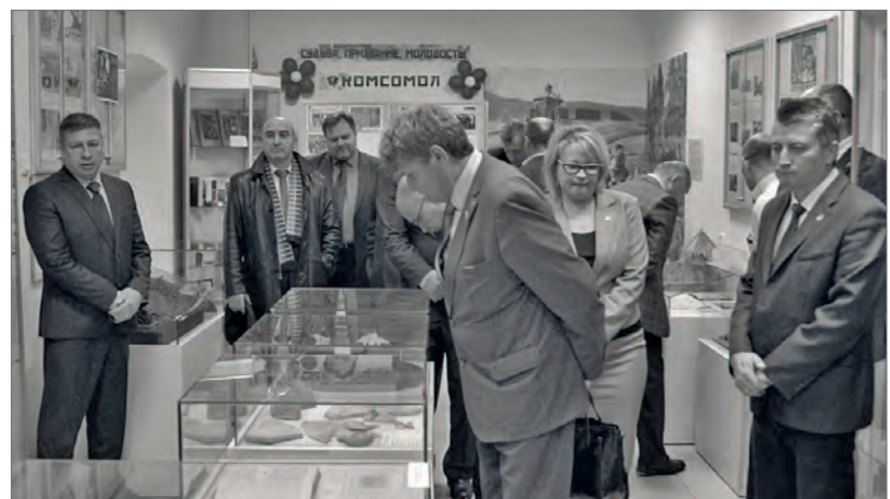
● Затем глав пригласили на экскурсию в музей Бисертского городского округа