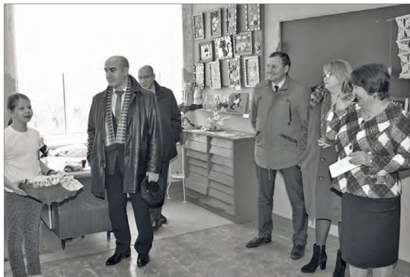
● Дети, занимающиеся в Доме детского творчества, подарили забавных вязаных совят