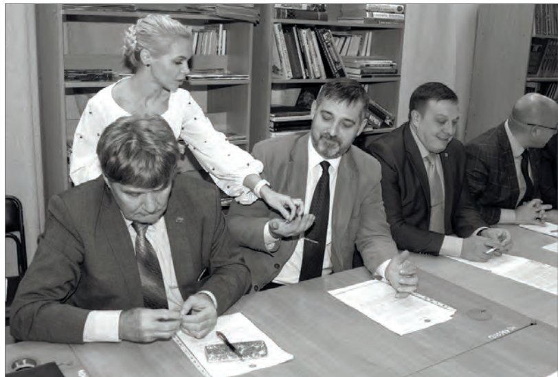
● Участникам совещания подарили памятные комсомольские значки...