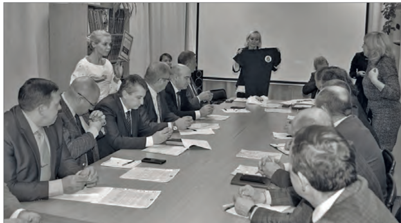
● ... и футболки