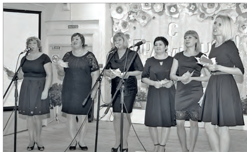
● Выступление коллектива детского сада «Колокольчик»