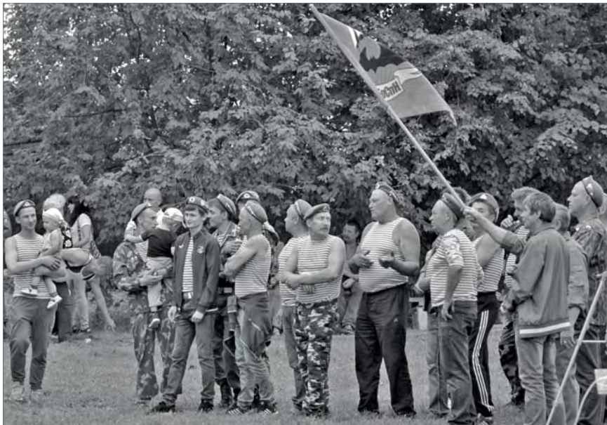
● 2 августа в парке ДК «Искра»

их доблесть и верную службу России. Кроме того, он напомнил, что 3 сентября этого года, в День солидарности в борьбе с терроризмом, в Екатеринбурге - рядом со школой № 97 - будет открыт памятник в честь Героя России Александра Гуменюка, ученика этой школы, офицера подразделения «Альфа», погибшего во время боевого столкновения в Грозном в 2001 году.