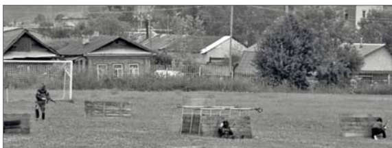
● Пейнтбол на стадионе при ДК «Искра»

Выступали как местные артисты - группа «Руянь», так и гости Бисерти - коллектив «Без происшествий»