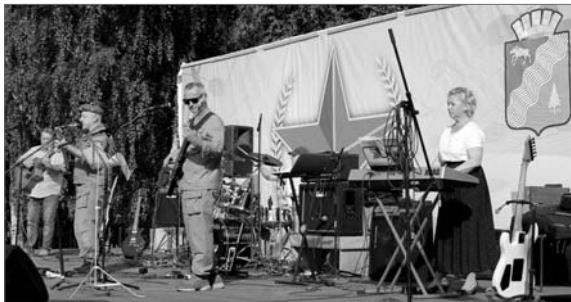
● Концерт в парке ДК «Искра»