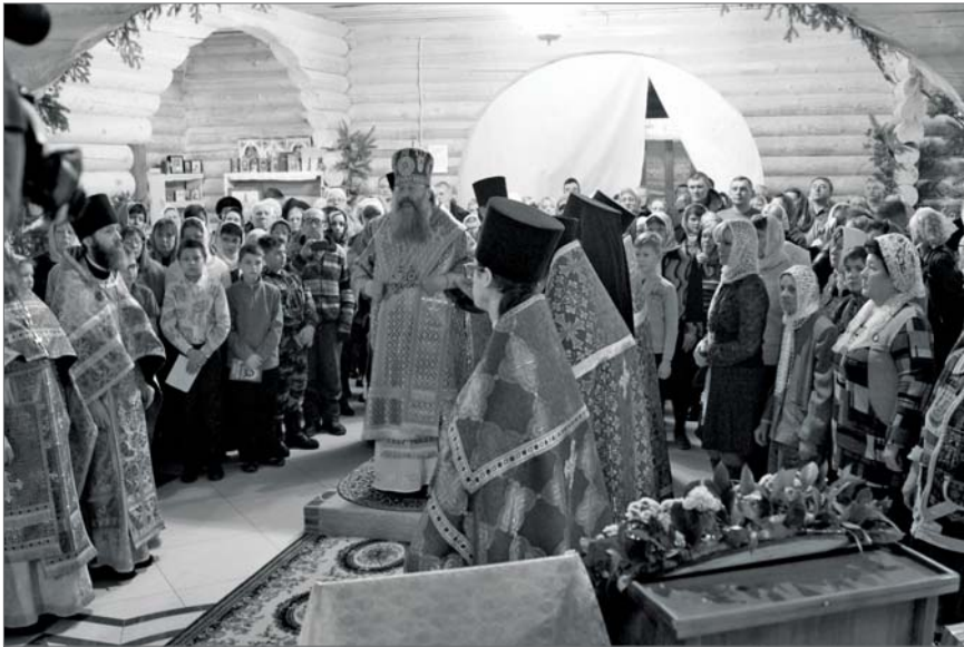
● Праздничная служба в новом Храме