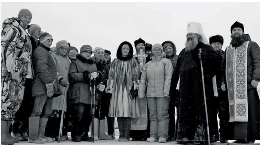
● В Первомайском