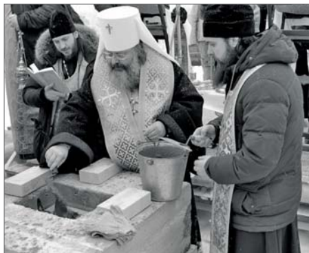
● Закладка кирпичей в фундамент часовни