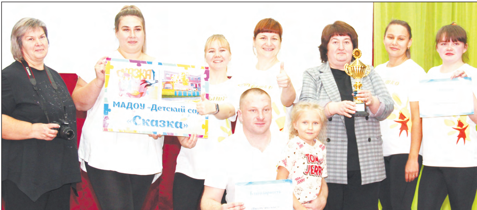
Инициативны, талантливы. Победитель - команда детского сада «Сказка»

20 октября Манчажский спортивно-оздоровительный центр принимал гостей. Объединение детских, подростковых и молодежных клубов собрало команды на Слет работающей молодежи «Вместе мы сила!» Всего участвовало восемь команд: «Сказка» (МАДОУ Детский сад «Сказка»), «Училки» (МАОУ «Манчажская СОШ»), «Мастер и Маргарита» (МБУ «Централизованная библиотечная система АГО»), «Техникум» (ГАПОУ СО «Артинский агропромышленный техникум»), «Педагоги» (ГАПОУ СО «Артинский агропромышлен-