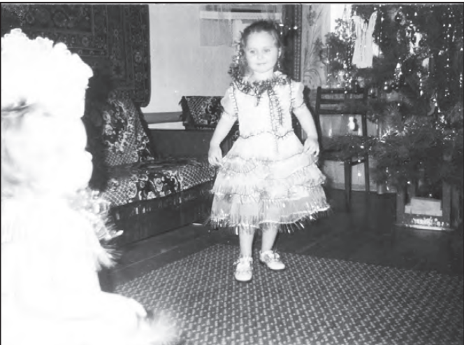
Танец снежинок у елки. пожеланиями от доброго Дедушки, с которым так таинственно и радостно от- крывается праздник Нового года!