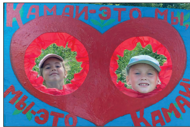
Живем не в Камаях, но корни здесь