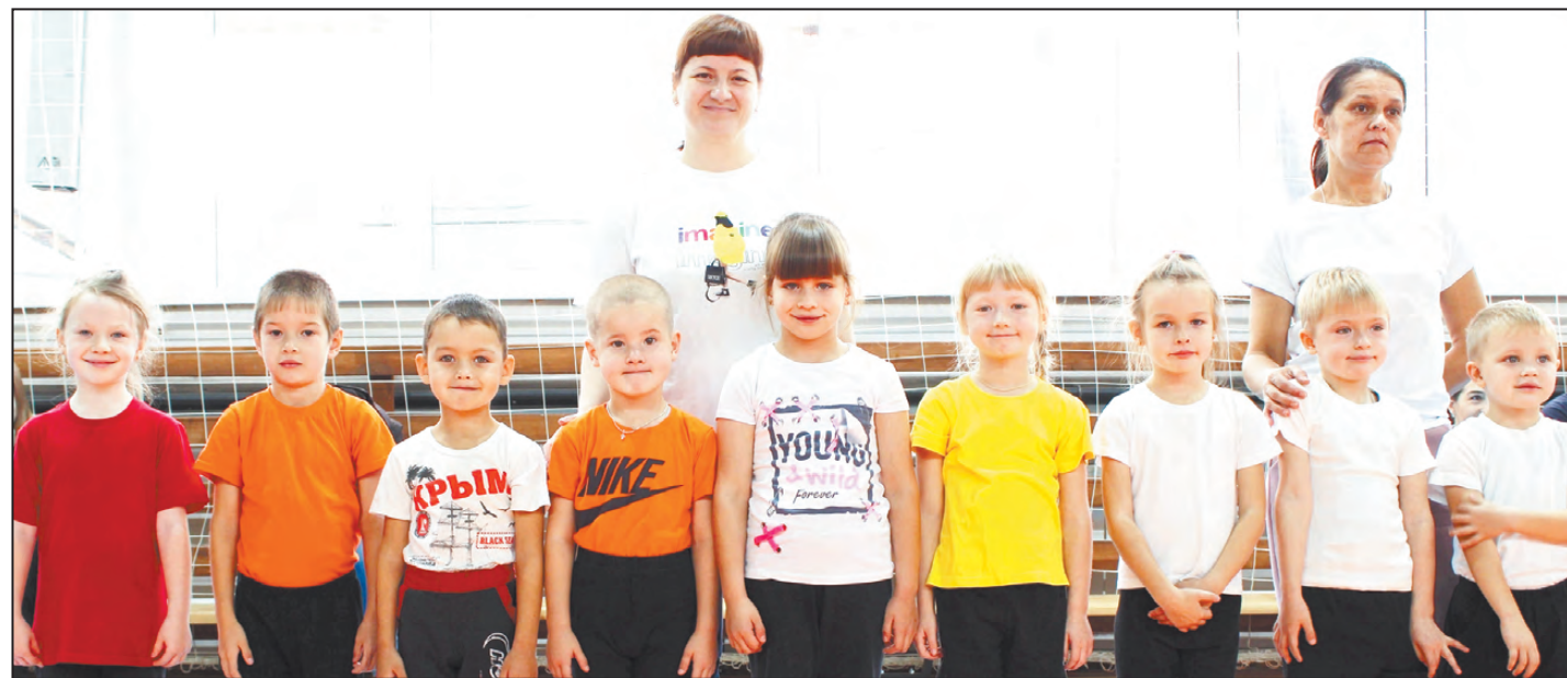
Мы готовы бегать, прыгать и к победам стремиться

В рамках месячника «Мы за здоровый образ жизни» в октябре прошли лично-командные соревнования по общей физической подготовке воспитанников дошкольных образовательных организаций Артинского городского округа, в которых приняли участие дети старших и подготовительных к школе групп детских садов «Радуга», «Сказка», «Солнышко», «Капелька», «Березка» и села Азигулово. Состав команды - три девочки, три мальчика.