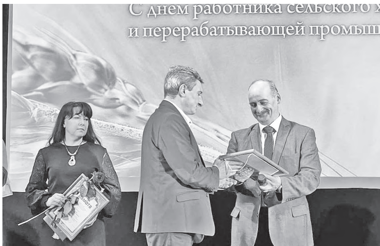
Лучшим из лучших работникам села на сцене ДК «Энергетик» вручили грамоты и благодарности

В пятницу итоги работы сельхозсектора на территории АГО со сцены озвучил начальник Режевского управления АПК (куда входит и наш район) Павел Саввулиди. Он