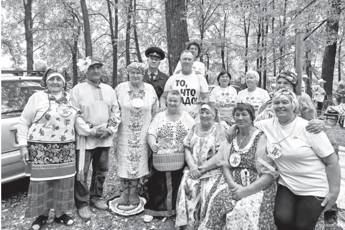
Летние праздники очень сближают жителей

- Депутатский запрос – форма работы депутата по решению наказов избирателей. Я считаю, что такие методы неприемлемы, если мы работаем в команде. Нельзя депутату тянуть одеяло на себя – а это средства бюджета, когда на сосед-