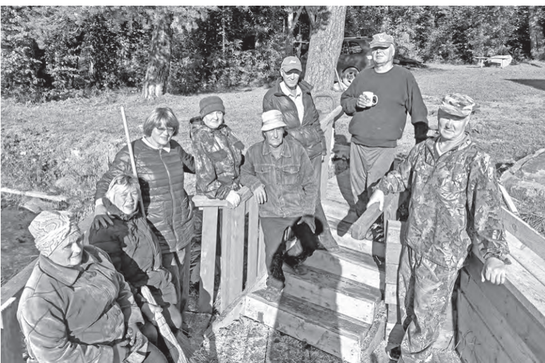
Один из последних субботников лета 2022 прошел на роднике Талый ключ