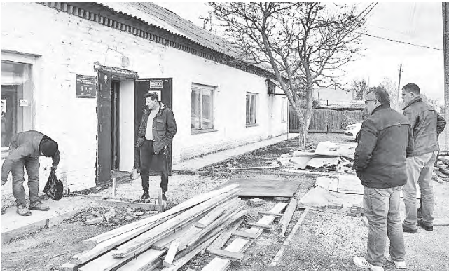
Это здание давно требовало ремонта

В фельдшерско-акушерском пункте села Лебёдкино весь ремонт – снаружи, поэтому в ФАПе идёт полноценный приём пациентов. На здании уже сияет новая крыша. С крыши недобрым взглядом смотрят голуби: их привольному житью на чердаке пришёл конец. Руководитель подрядной организации говорит, что птицы даже атаковали строителей, когда