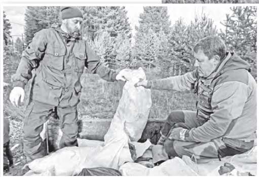
Теперь в местах свалок установят фотоловушки / Фото: Василий ЕРГАШЕВ, "АР"

Большая чистка вокруг лыжной базы «Снежинка» этим летом была особенно массовой, и многие жители не раз принимали участие в уборке. На нее выходили экологи, депутаты, школьники, бюджетники