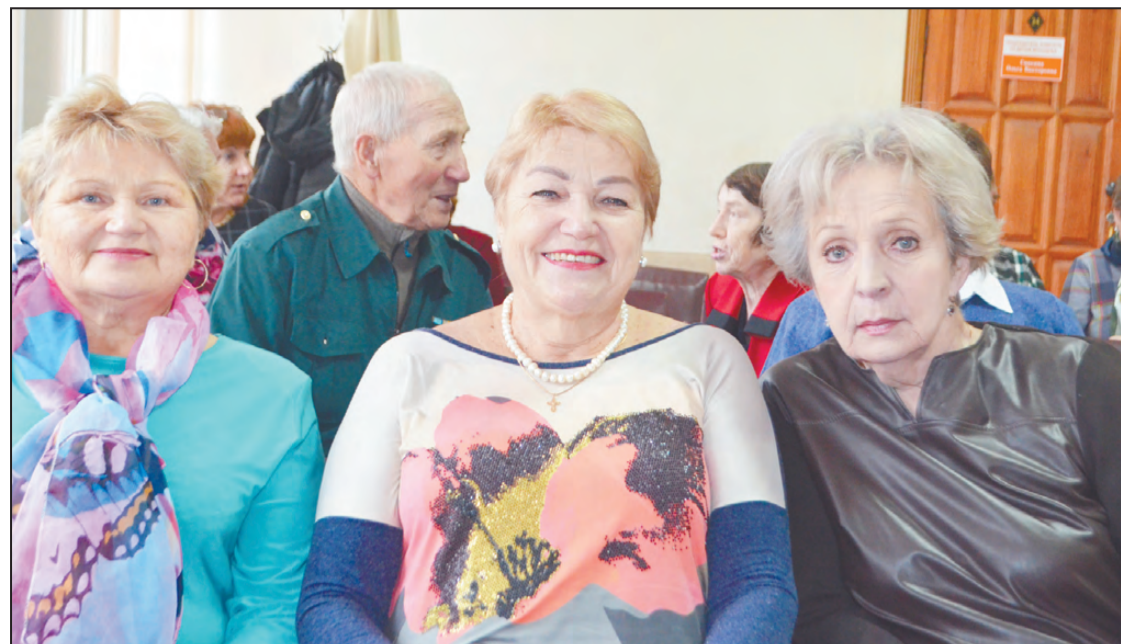
За пять минут до начала собрания: отдохнуть на пенсии некогда!

Следующий этап - публикации в СМИ о ветеранах войны, тружениках тыла. По положению о смотре-конкурсе здесь