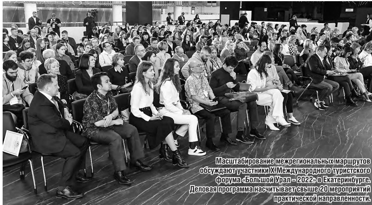
Масштабирование межрегиональных маршрутов обсуждают участники X Международного туристского форума «Большой Урал – 2022» в Екатеринбурге. Деловая программа насчитывает свыше 20 мероприятий практической направленности.

«Этим летом на Петербургском экономическом форуме губернаторы пяти субъектов подписали соглашение о создании макротерритории «Большой Урал». Задача – свериться по этим проектам, показать нашу готовность к реализации межрегиональных маршрутов и туристской инфраструктуры»,