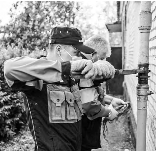
По информации департамента информационной политики Свердловской области.

Ранее Евгений Куйвашев заявлял, что по итогам программы догазификации к 2030 году голубое топливо подведут к 90 процентов жилых домов Свердловской области.