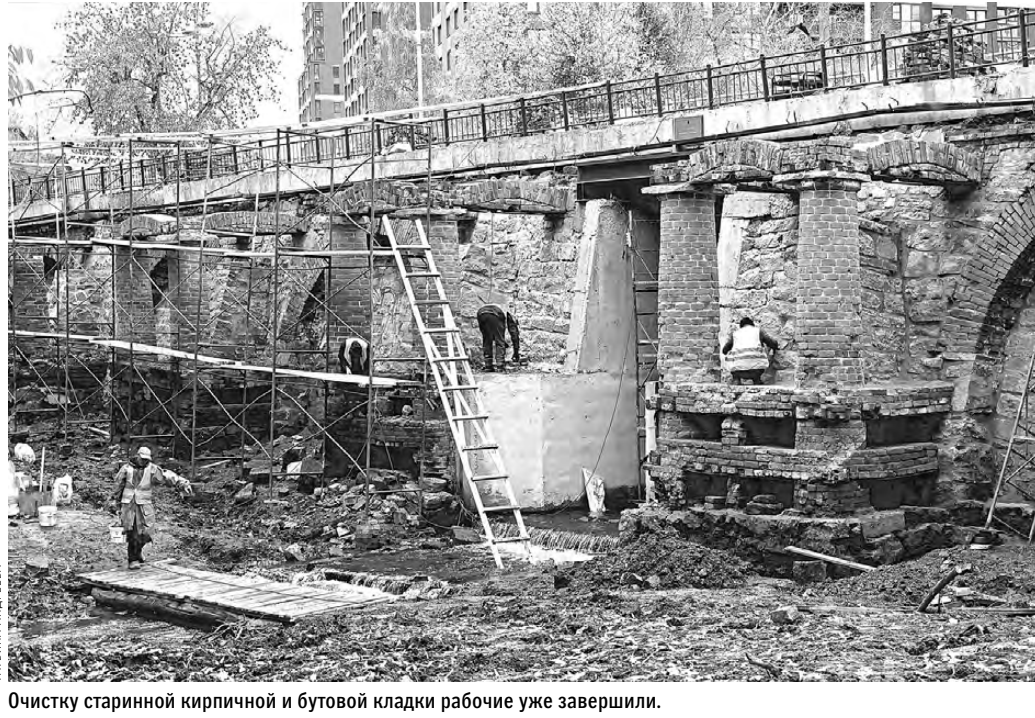
Очистку старинной кирпичной и бутовой кладки рабочие уже завершили.

— Да, удар нанесен мощнейший, очень концентрированный и широкополюсый — от него невозможно было уклониться. Но даже в апреле, когда еще никто не понимал, что делать в этой ситуации, были дезориентированы не более одного-полтора процента руководителей компаний. А в последние время, иде-то с июля, я вообще перестал слышать нотки неуверенности. Да, нам часто говорят о проблемах, порой они очень серьезные. Но поражает безответность бизнеса, особенно на Урале, его быстрая адаптация, стремительное принятие решений компаниями самых разных «весовых категорий». Надо сказать, что пандемия очень хорошо подготовила предпринимателей к нынешней ситуации: уже нет надежды на то, что завтра все вдруг само рассосется, или ожиданий, что государство примет чудовищные решения за бизнес. За два пандемийных года были разработаны стратегии, и хотя таких масштабных санкций не ждал никто, но все же компании оказались к ним подготовлены: найдено и принято множество интересных решений, быстро переформатированы взаимоотношения с поставщиками. Ряд компаний покупает уходящие из России производства и решительно меняет их лицо. Меня все это поражает и восхищает.