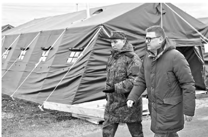
ПРЕСС-СЛУЖБА ГУБЕРНАТОРА ЧЕЛЯБИНСКОЙ ОБЛАСТИ

Как сообщили в региональном минпроме, по сути, мобилизация экономики началась еще весной. После ужесточения санкций в Челябинске впервые организовали Всероссийский форум «Импортозамещение. Новые возможности», на котором губернатор выступил с инициативой объединить региональные базы комплектующих и материалов на одной площадке. Идея одобрена в Минпромторге РФ, и сегодня обмен информацией между разными регионами страны значительно упростился.