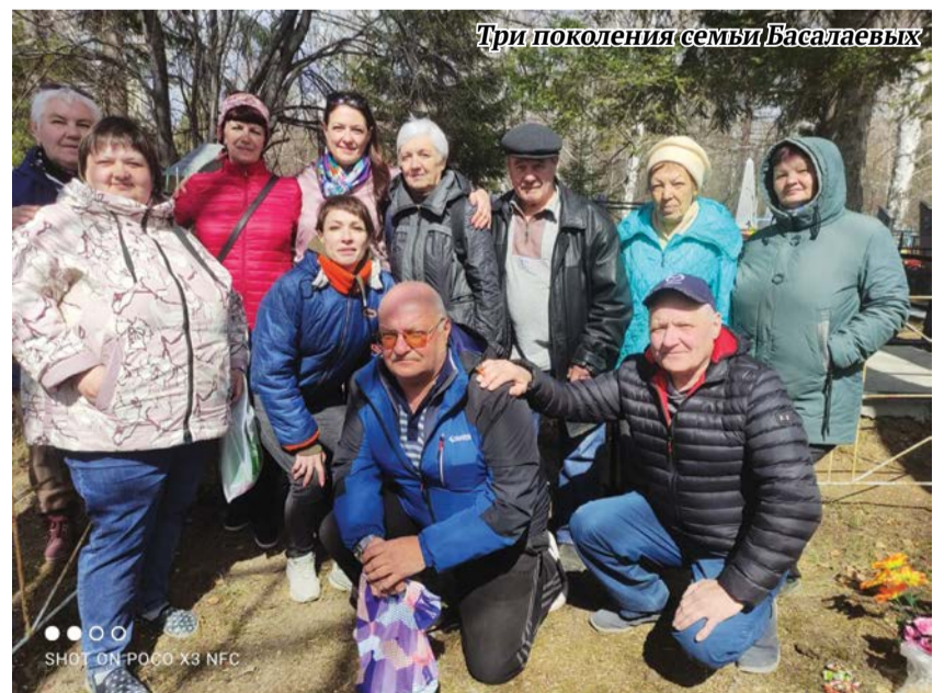
Три поколения семьи Басалаевых

Подготовила Татьяна ГРИГОРЬЕВА