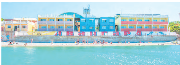
Гости Николаевки останавливаются в пансионате «Авангард».

Поселок Николаевка основали в 1858 году и назвали в честь Николаевского источника, бьющего в этих местах. В XIX веке здесь находилась царская таможня, через которую шла торговля зерном в Англию, Францию и другие европейские страны. После 1917 года на ее территории располагалась пограничная часть. Но со временем она утратила свое значение, и в 1961 году на ее месте появился спортивно-оздоровительный центр «Авангард», который позже был преобразован в пансионат. Здесь готовились летом к ответственным соревнованиям сборные бывшего СССР, а также олимпийские чемпионы, чемпионы мира и Европы. И сегодня юные спортсмены со всего Крыма и других регионов РФ могут тренироваться на базе пансионата.