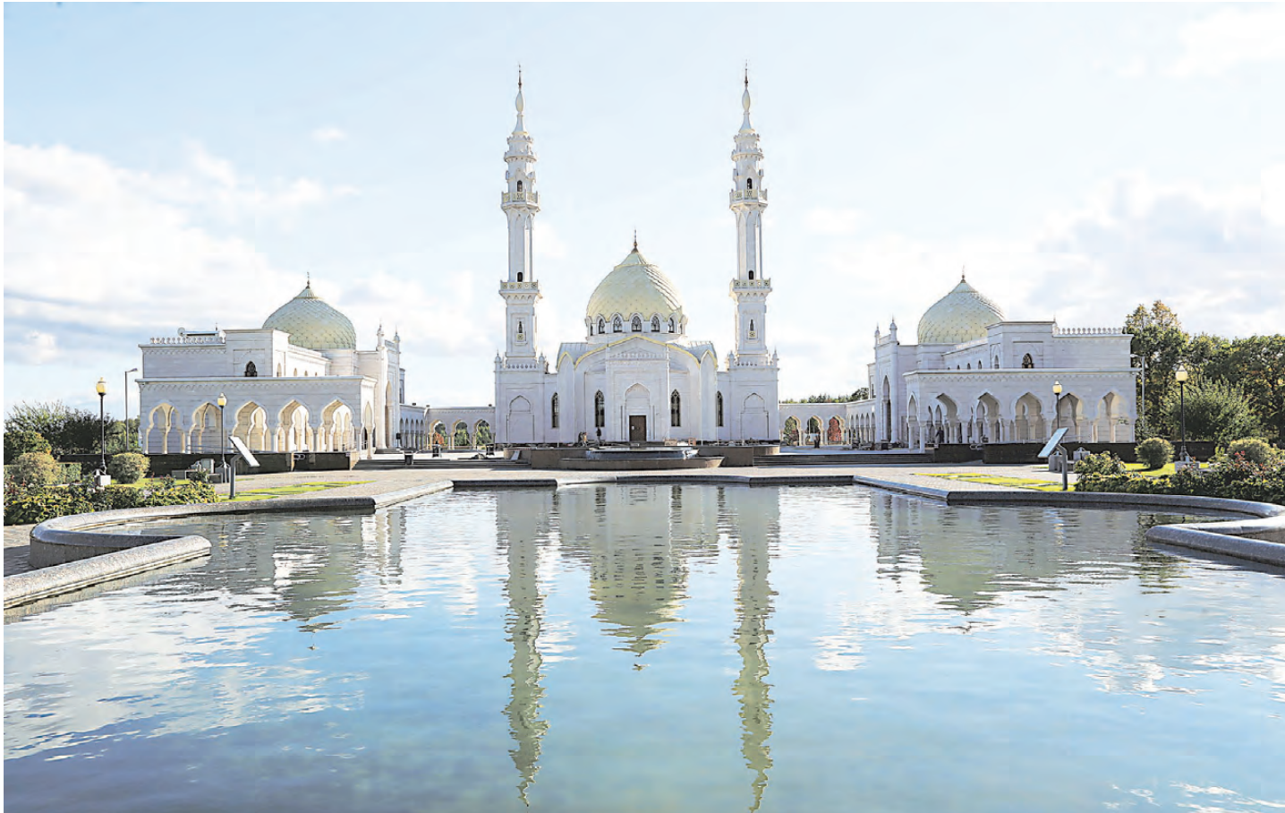
Белая мечеть — одна из красивейших достопримечательностей Болгара.

В Татарстане отпразднуют 1100-летие принятия ислама Волжской Булгарией