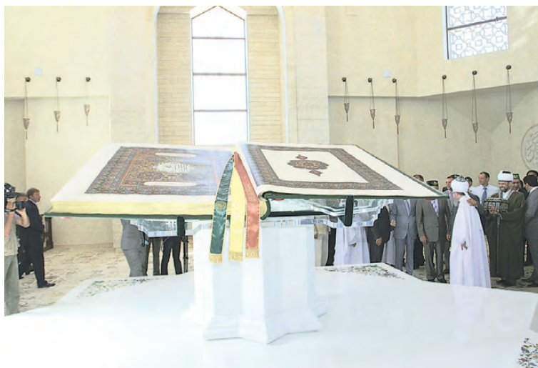
В Болгарском музее-заповеднике можно увидеть самый большой Коран в мире.