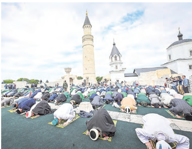
В честь торжеств тысячи мусульман прочтут намаз в древнем городе.