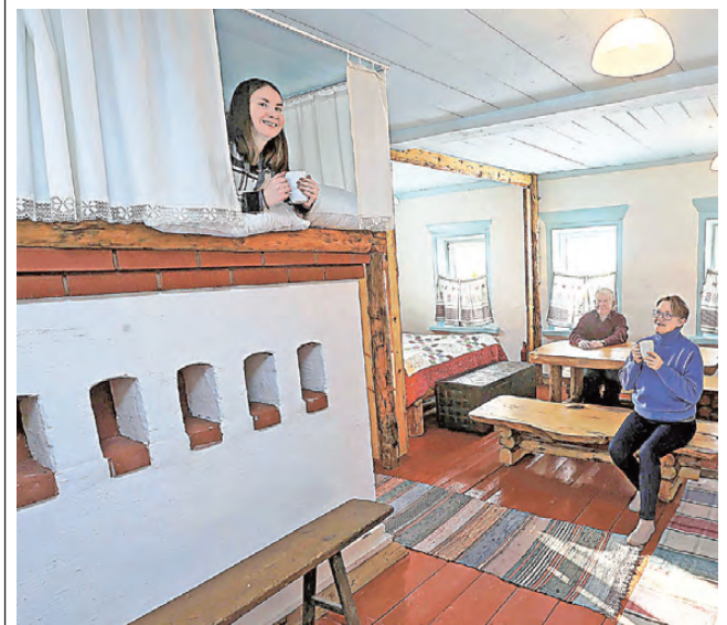
Два лучших места в Избе приказчика — на печи.

Чем еще заняться в Мариинске? Прежде всего посмотреть единственную в мире вскрытую, демонстрирующую свое внутреннее устройство, плотину демидовских времен. Ее соорудили для Мариинского завода еще в XVIII веке. Есть необычное развлечение — искать клады (или старинные вещи) в окрестностях старого завода, для этого можно даже взять на прокат металлоискатель. Конные прогулки, катание на санях, коньках и лыжах, рыбалка (а пруд здесь богат рыбой), мастер-классы по вы-