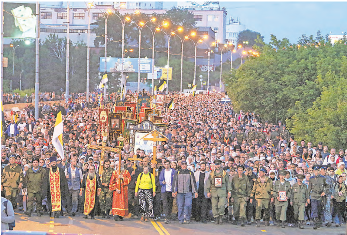
В год 100-летия трагической гибели царской семьи в июле 2018 года крестным ходом от Храма-на-Крови до Ганиной Ямы прошли 100 000 человек.

Крестные ходы объединяют тысячи паломников