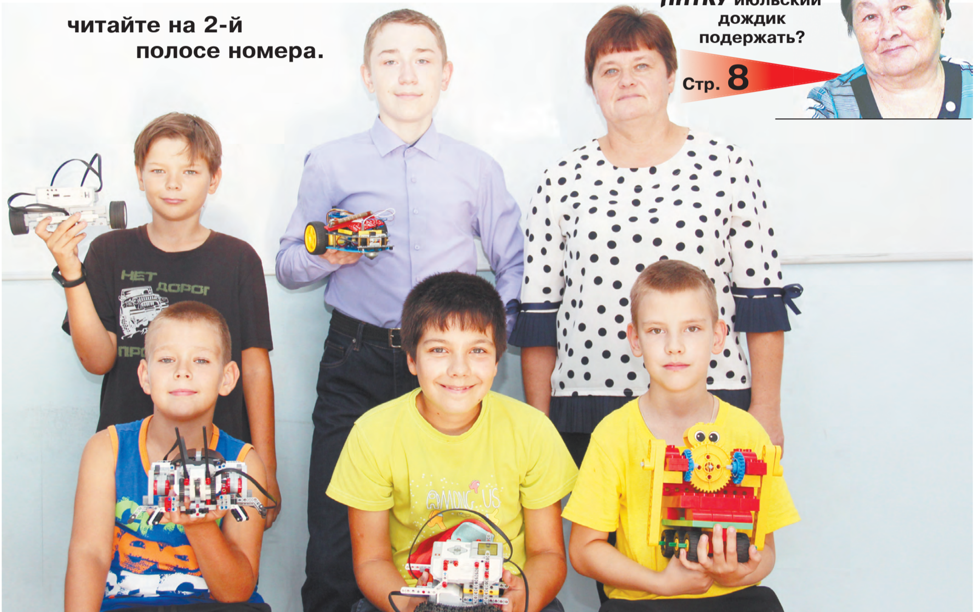
Когда в руках - будущее.

- ПРЕДСЕДАТЕЛЬ-ТО КОЛХОЗА У ВАС ГРОЗНЫЙ? - спрашиваю. - Это я, - говорит шофер.