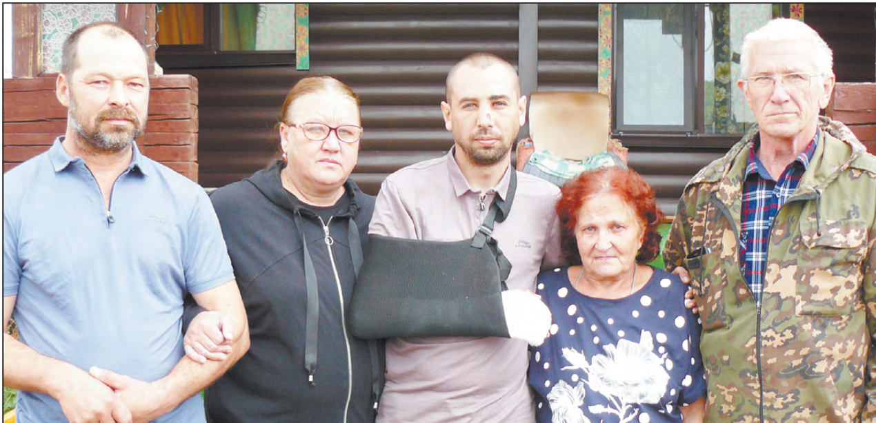
Старовойтовы и Щербаковы