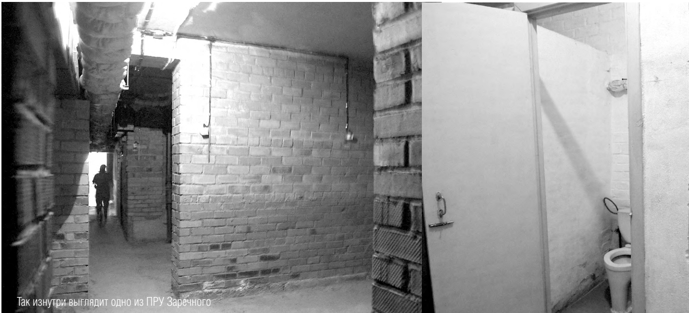
Так изнутри выглядит одно из ПРУ Заречного

Как устроена система защитных сооружений на случай ЧС, и готова ли она принять зареченцев?