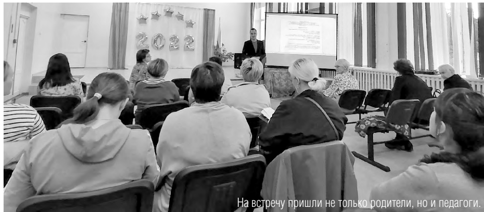
На встречу пришли не только родители, но и педагоги.

Важно, что на встрече специалисты проговорили основные проблемы, которые необходимо решать для организации работы с особыми детьми. И главная их них - кадровая. В обязательном порядке дети с ОВЗ должны заниматься с логопедом, дефектологом, психологом. И именно таких специалистов сейчас Заречному не хватает. Если в «ЦППМиСП» (Центр психолого-педагогической, медицинской и социальной помощи) все ставки открыты, то в целом, по Заречному открыты около 30 ставок логопедов, 18 ставок педагогов-психологов, 20 ставок дефектологов.