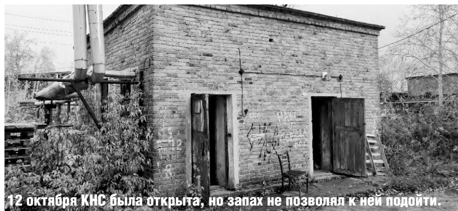
12 октября КНС была открыта, но запах не позволял к ней подойти.