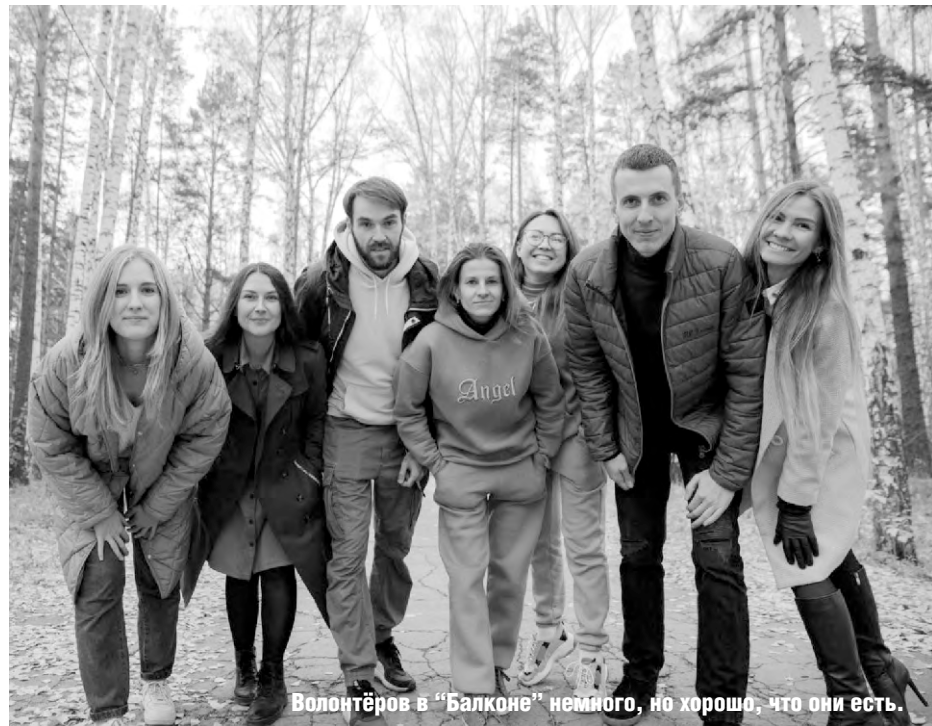
Волонтеров в «Балконе» немного, но хорошо, что они есть.

К человеческому фактору добавился финансовый: вторсырьё подешевело, и его сдача уже не закрывала аренду помещения, которая с февраля, наоборот, выросла. Так, уже в июне, сведя дебет с кредитом, экологисты поняли, что от продажи вторсырья получили средств на треть меньше, чем за прошлый период. Цена картона и бумаги за кг уменьшилась на 50 %, стоимость PET-бутылок снизилась на 40 %, «просел» весь металл, в том числе алюминий, - на 50 %, цены на плёнки за кг уменьшились на 15 %.