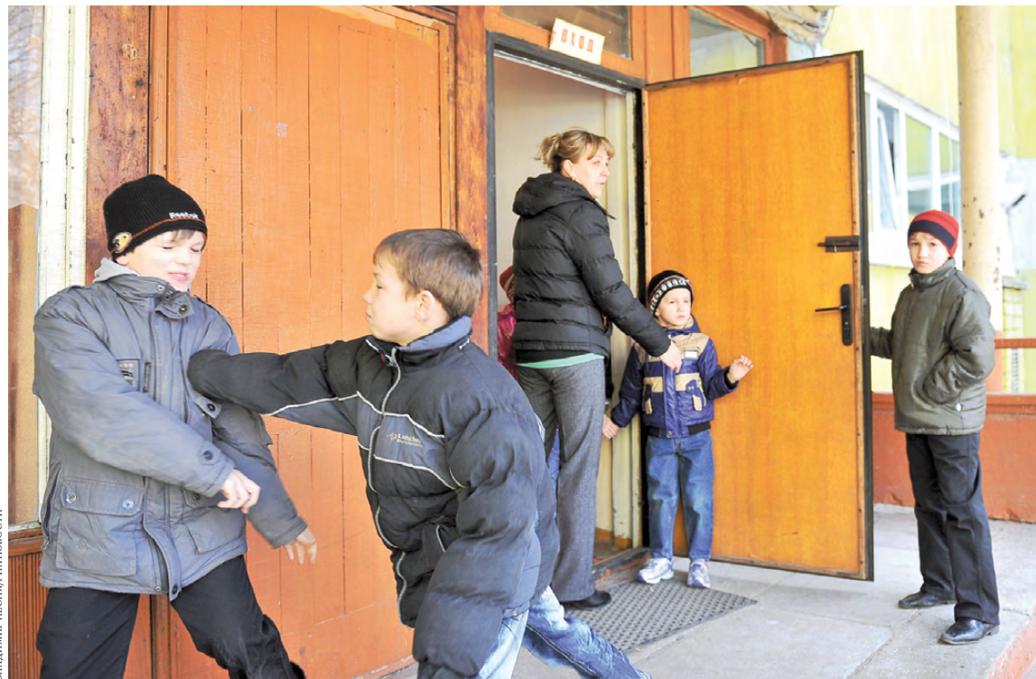
ВЕЛАМИР ПЕСИЯРИА НОВОСТИ

Подобного рода состояния требуют совместных усилий со стороны социальных работников, психо-