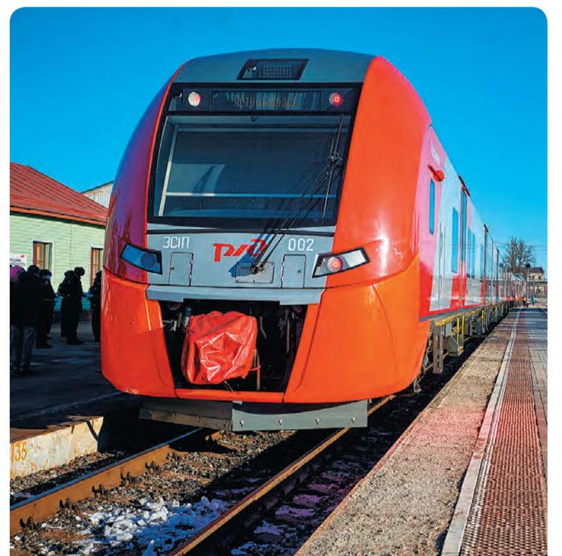
Скоростной электропоезд «Ласточка» будет следовать через станцию «Бисертский завод» четыре раза в сутки – по два раза в каждую сторону.

В Свердловской области «Ласточки» курсируют из Екатеринбурга в Нижний Тагил, Серов (через Кушву), в Шалю и Кузино (через Первоуральск) и в Каменск-Уральский. Со 2 сентября скоростные электрички вышли на новый маршрут Екатеринбург – Качканар.