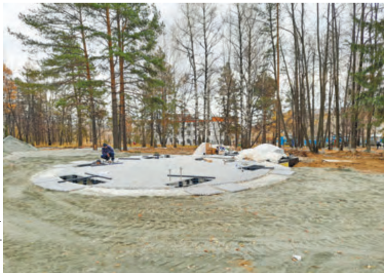
Ведется строительство фонтана

Перед началом строительства администрация ставила перед подрядчиком задачу закончить объект в сентябре. Однако видно, что работ предстоит еще много, а до завершения проекта далеко.