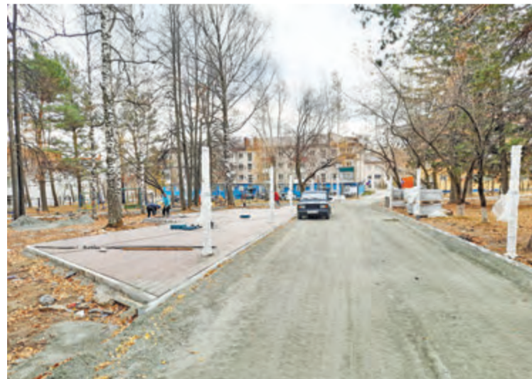
Расширены дорожки, установлены фонари