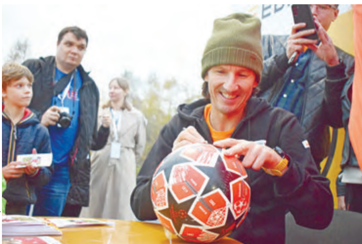
Желающие могли получить автограф от Алексея Смертина