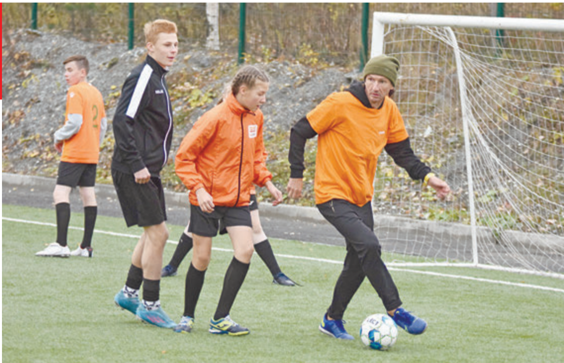
Экс-капитан сборной России по футболу Алексей Смертин с удовольствием поиграл в футбол с воспитанниками ДЮСШ «Олимп»

Вечером 6 октября известный футболист Алек-