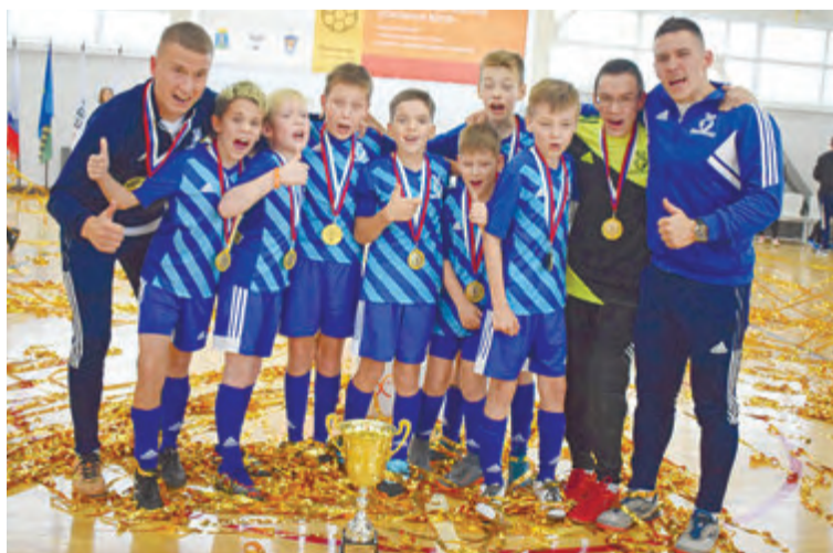
Команда «Динамо-Кузнечики» из Ижевска стала чемпионом России