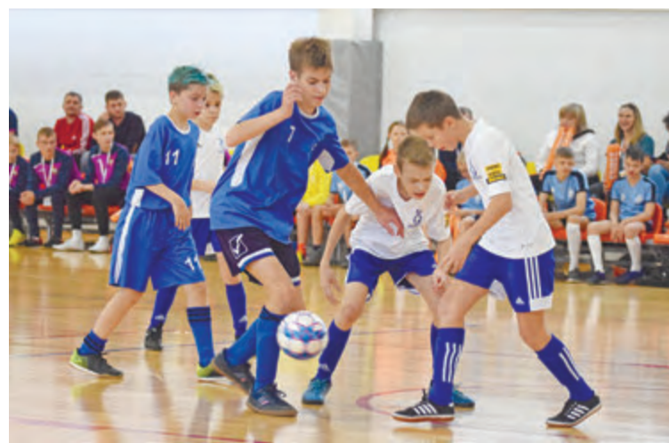
В каждом матче сохранялась интрига. Кто станет победителем?

Обладателем трофейного кубка стала команда «Динамо-Кузнечики» из Ижевска. Серебряные медали завоевали футболисты из команды «Спартак-Москва» (г.Москва). Третье место заняла команда «ЦСКА» (г.Москва).