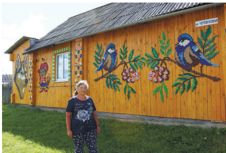
Фасад дома четы Загоскиных