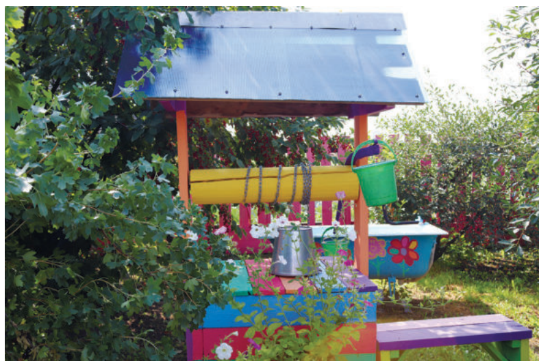
Колодец усадьбы Устиновых

ют пейзаж – хвойные деревья, из которых Гоголевы высадили небольшую аллею, благо площадь участка позволяет фантазии разгуляться.