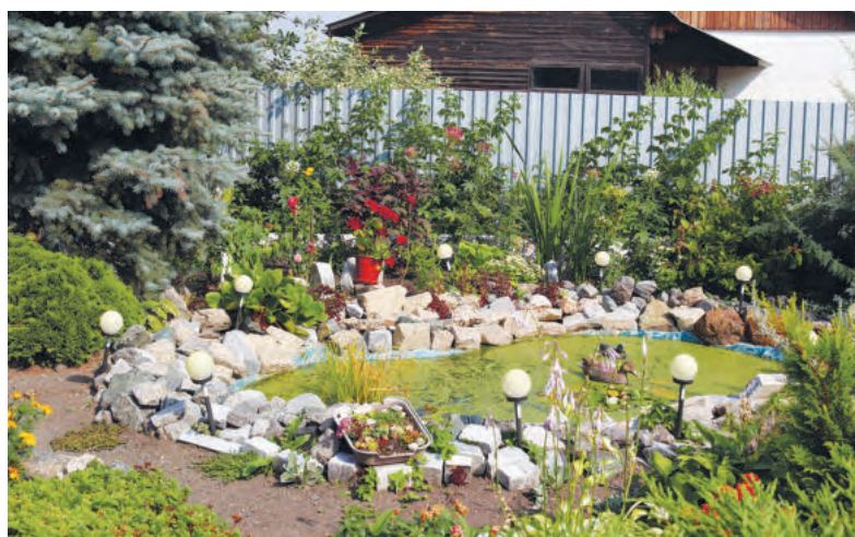
Искусственный водоем Галины Чувашиной