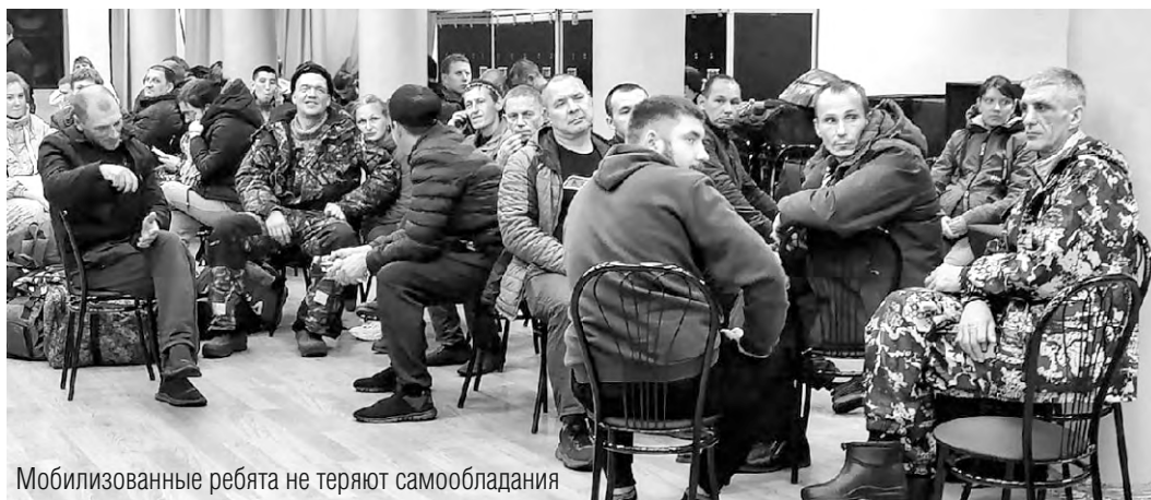
Мобилизованные ребята не теряют самообладания