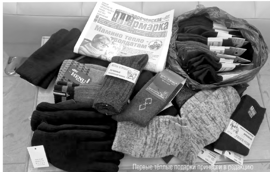
Первые тёплые подарки принесли в редакцию

Также в редакцию пришла та самая неравнодушная женщина, которая подвигла нас к идее сбора тёплых вещей солдатам (она попросила не афишировать её имя). Сама зареченка вязать не умеет, поэтому приобрела 12 пар качественных шерстяных носков и 5 пар перчаток. А ещё она принесла подарок от продавцов бутиков торгового центра «Галактика». Представительницы торговли, когда прочитали в газете о нашей акции, поспешили внести свой вклад - 9 пар шерстяных носков и 1 пару перчаток.