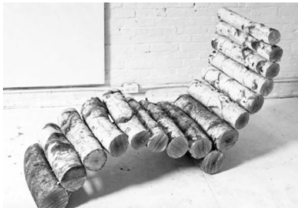
Лежак из цельных брёвен