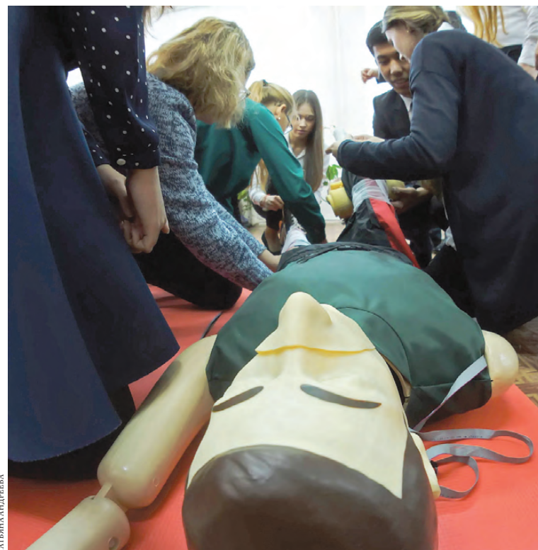
Оказывать первую помощь школьники учатся на уроках ОБЖ.

Кстати, нынешний приближенный к больничным реалиям проект не первый в региональной программе медицинской подготовки школьников. С прошлого года в десятках уральских школ возродили медклассы, где особое внимание уделяют как предметам, необходимым для поступления в специализированный вуз или медучилище, так и новым дисциплинам. Например, в первоуральском лицее № 21 ученики профильных классов изучают медицинскую биологию, микробиологию, биохимию. Два медицинских класса с нынешнего года открыты в школах Нижнего Тагила.