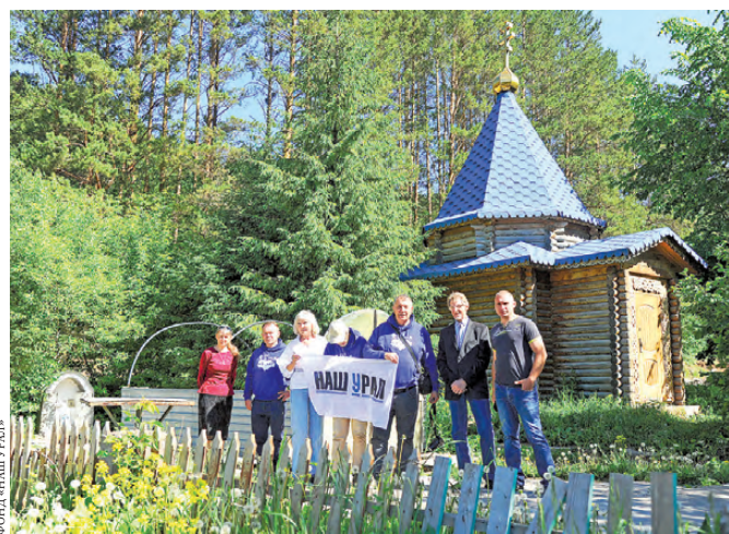
За несколько лет энтузиасты побывали в 55 городах трех регионов Урала.