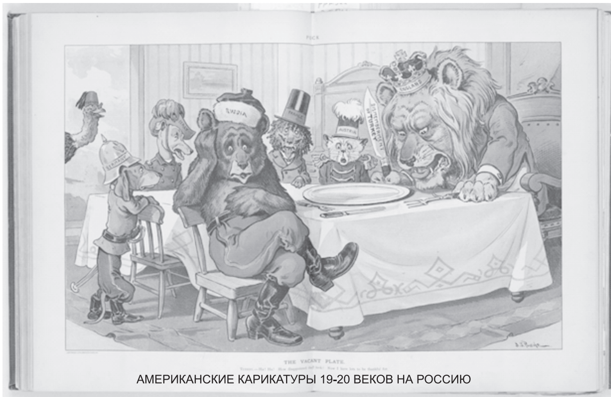
АМЕРИКАНСКИЕ КАРИКАТУРЫ 19-20 ВЕКОВ НА РОССИЮ

простившими нам свое поражение. Америка никогда не правила миром, ей это весьма удачно внушали долгое время истинные кукловоды - англосаксы. Странно, что сами американцы на полном серьезе верят в то, что измученный Альцгеймером и кучей болячек 80-летний Байден может управлять великой страной. Нет, за ниточки дергают настоящие правители, которые не решаются больше противостать открыто России, слишком памятна «звездюли», отхваченные при попытке вмешиваться в наши дела. Да, Англия практически не вела полномасштабной войны против России сама (исключая Крымскую войну), но тайная война не прекращалась столетиями. Лондон всегда был с нами в недружественных отношениях. Именно англосаксы создали мировую рабовладельческую империю, которую перенял у них Гитлер. Британцы первыми озвучили идеологию расизма, социального дарвинизма и евгеники, построили первые концлагеря, использовали методы террора и геноцида для подчинения «неполноценных» народов и племен. К примеру, в Северной Америке, Южной Африке, Индии и Австралии они умело использовали племенную и национальную элиты, чтобы подчинять себе огромные массы людей. А Россия стоит на пути любого, кто претендует на мировой трон. Кому в мире не напакостили саксы? Испания, Франция, Германия, с которыми Англия боролась за лидерство в Европе, и даже небольшая Дания. А если вспомнить зверства британцев в Америке, Африке, Индии и Китае, становится ясно,