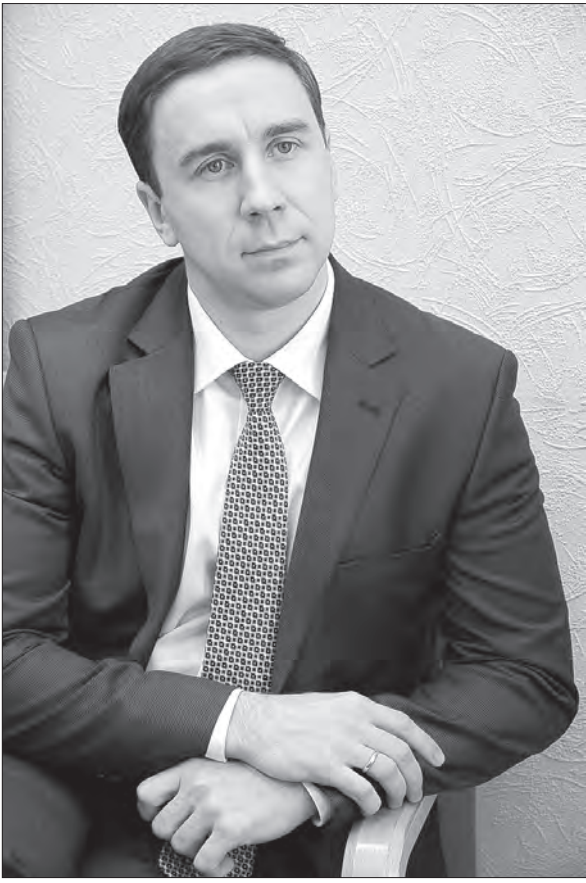
Министр транспорта и связи Свердловской области Александр Сидоренко.