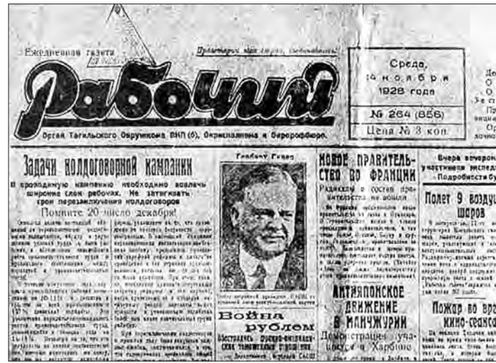
Номер газеты «Рабочий», 1928 год.