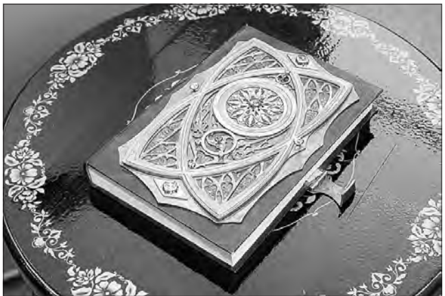
Книга отзывов – экспонат в музее и дипломная работа.

Людмила ПОГОДИНА.