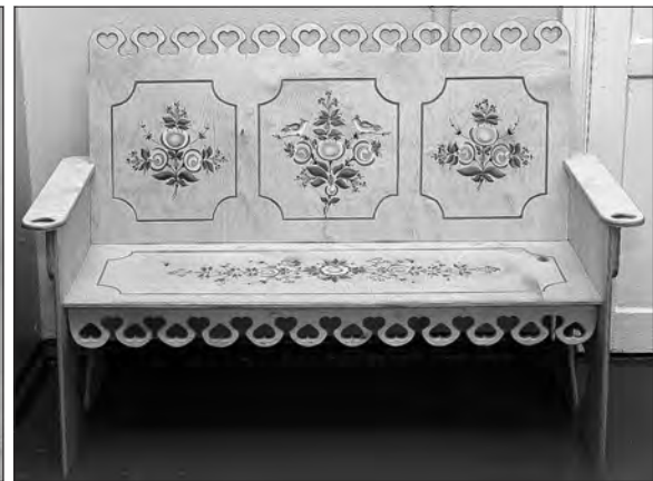
Диадема «Уралочка» Евгении Алимовой. «Скамья для влюбленных» Дарьи Нестеровой.