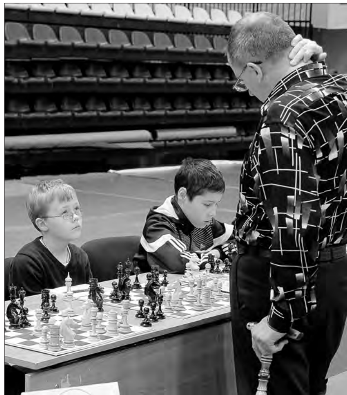
Шахматных досок - 290.