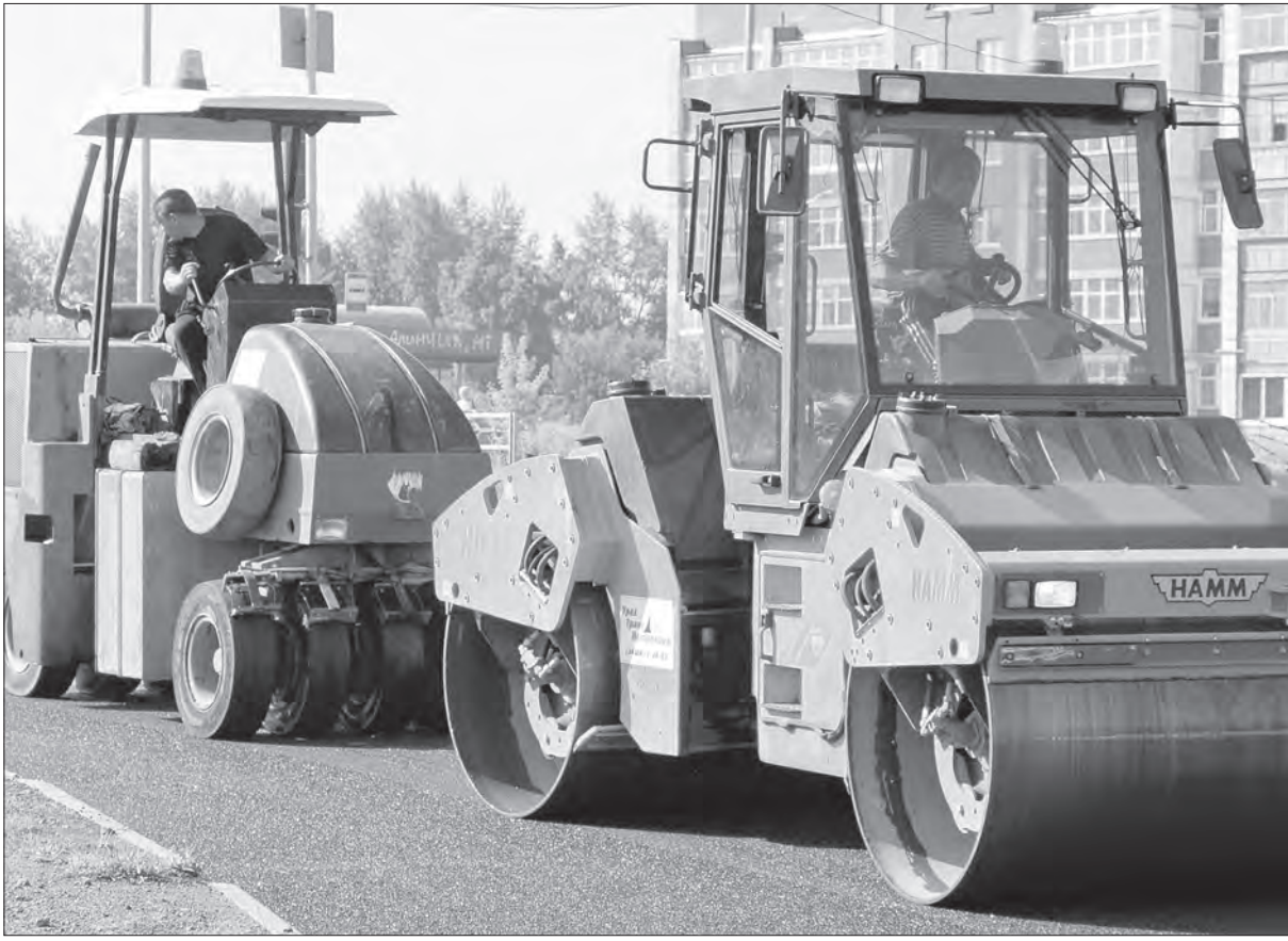
Здесь будет новая дорога.

Финиширует летний сезон дорожно-строительных работ. В Нижнем Тагиле он был нынче как никогда объемным и довольно успешным. Новое асфальтовое покрытие получили сразу несколько основных транспортных магистралей города, были сделаны цивилизованные подъезды автотранспорта к многоквартирным жилым домам. Дорожники не только ликвидировали отставание по объектам 2011 года, но и полностью выполнили задачи текущего года. Подвести предварительные итоги этой непростой работы, в основном финансируемой из областного бюджета, а также рассказать о перспективах дорожного строительства в Нижнем Тагиле мы попросили министра транспорта и связи правительства Свердловской области Александра Михайловича СИДОРЕНКО.