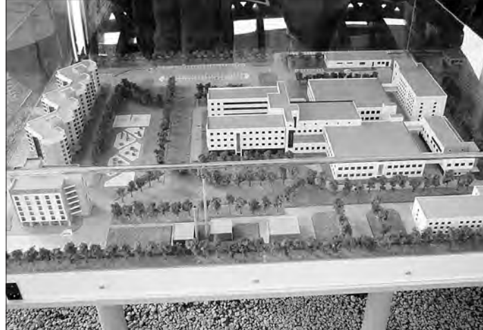
Макет госпиталя инновационных технологий.

Евгений Куйвашев поручил вице-губернатору Сергею Носову как можно скорее завершить процедуру