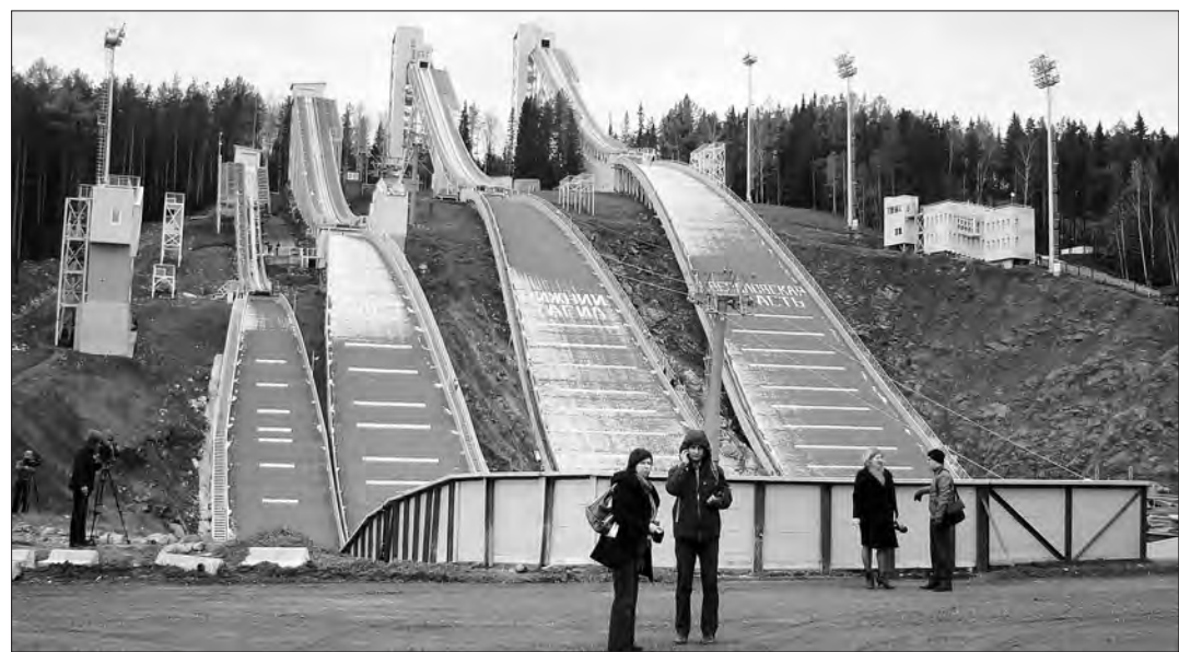
Комплекс трамплинов на горе Долгой.