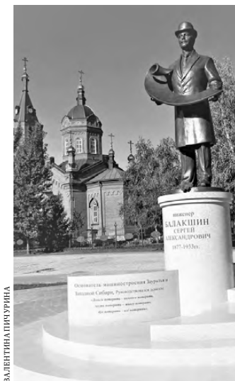
Скульптор постаралась запечатлеть человека в момент созидания.