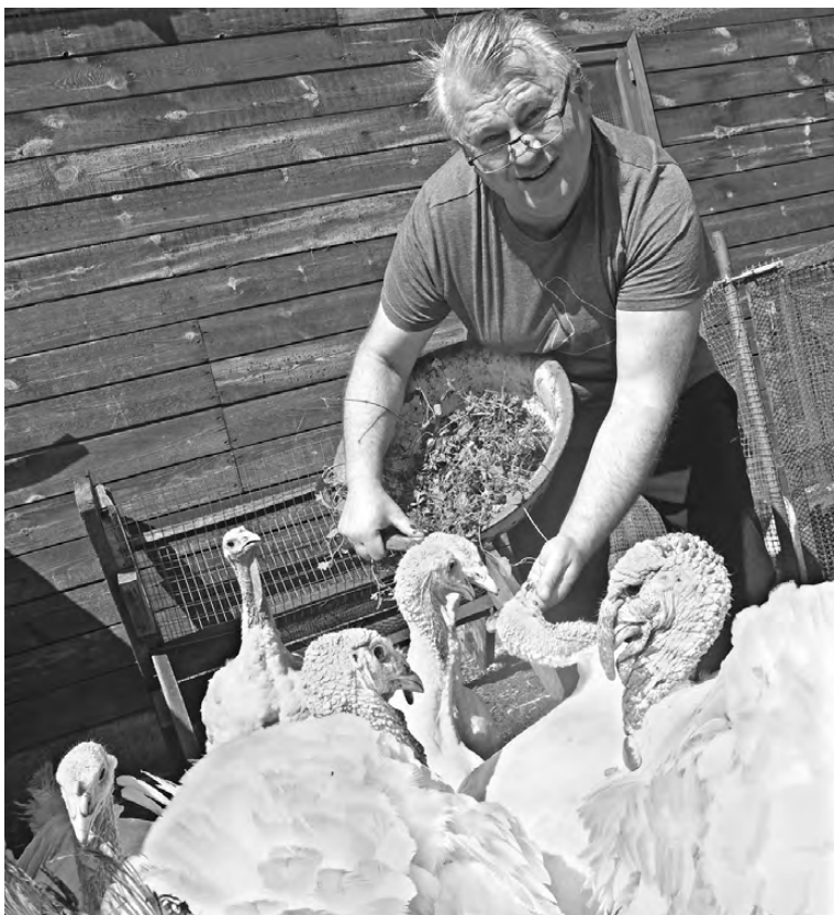
Индюкам уже больше трех месяцев, они окрепли и выдержали небывалую для Урала жару.