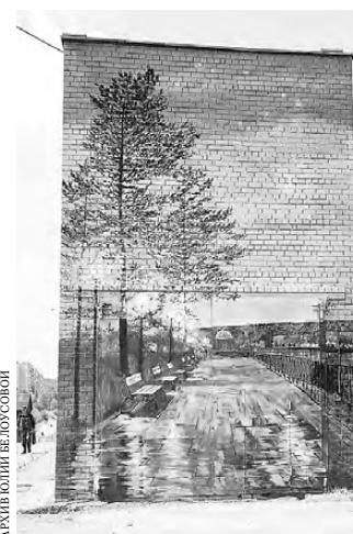
Граффити на стене — продолжение набережной.