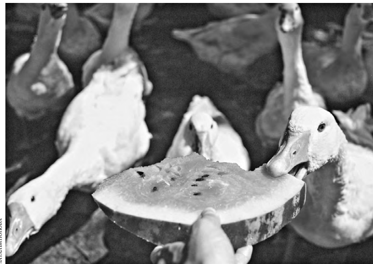
Любимое лакомство гусиного семейства — арбуз.