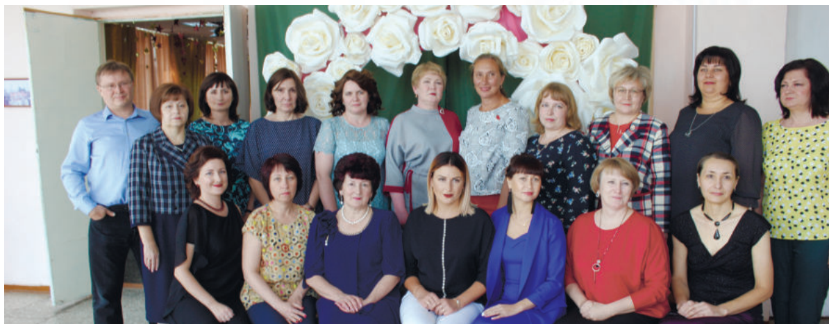
Уважаемые работники, ветераны финансового управления администрации Ирбитского муниципального образования, поздравляем вас с профессиональным праздником - с 220-летием финансовой системы РФ!

Глава Ирбитского МО, дума Ирбитского МО, Администрация Ирбитского МО, Ирбитская районная территориальная избирательная комиссия, председатели территориальных Администраций, местное отделение Свердловской областной общественной организации ветеранов, пенсионеров Ирбитского МО