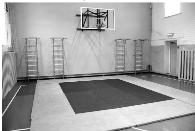
Обновленный спортзал Рудновской школы.

Подготовила Алена Дудина