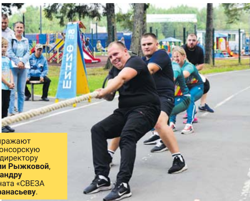
Команда посёлка Верхняя Синячиха

Параллельно с силовыми видами был дан старт военизированной гонке. В соревнованиях приняли участие четыре команды из города Артёмовского, МО Алапаевское («Урожай»), посёлка Верхняя Синячиха