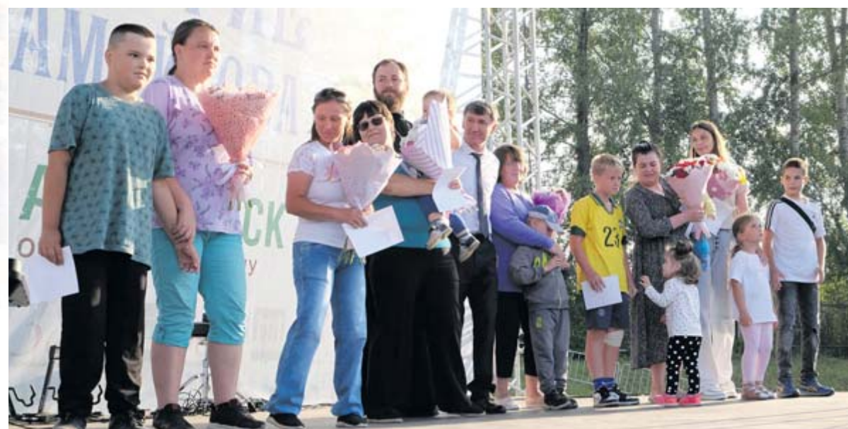
■ Вручение благотворительной помощи нуждающимся семьям