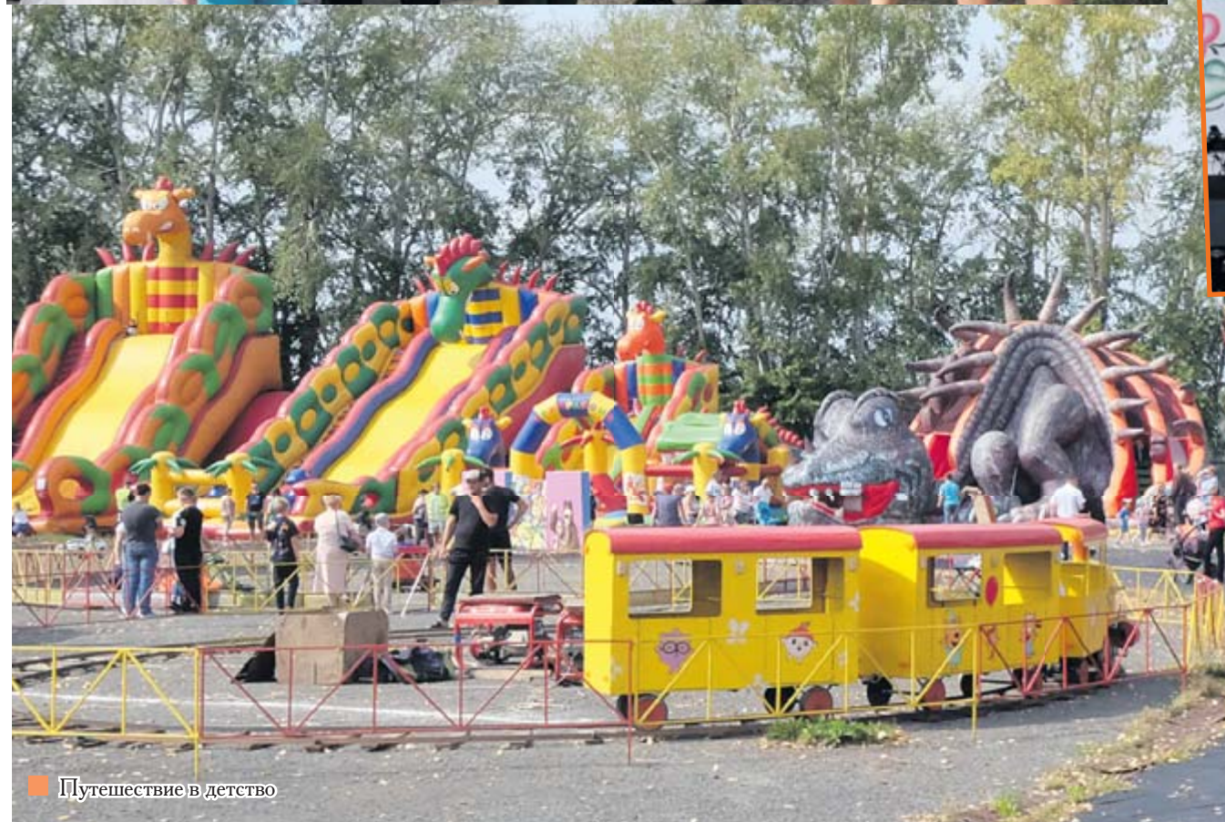
■ Путешествие в детство

Празднование Дня рождения города в этом году побило все рекорды за всю историю муниципального образования город Алапаевск. 27 августа на стадионе «Центральный» собрались около 15 тысяч человек, среди которых были не только алапаевцы, но и гости со всей Свердловской области. Почти 300 достойных жителей Алапаевска, треть которых – спортсмены, студенты и учащиеся образовательных учреждений, были награждены почётными грамотами и благодарственными письмами.