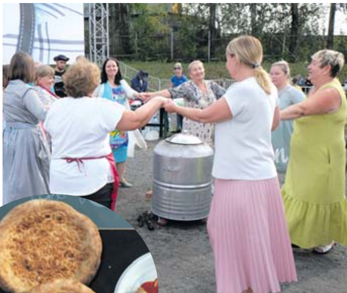
«Ритуальные» танцы женщин Алапаевска вокруг тандыра

Итак, команды на месте – у каждой свой стол, на котором в соответствии с выбором печи рецепт