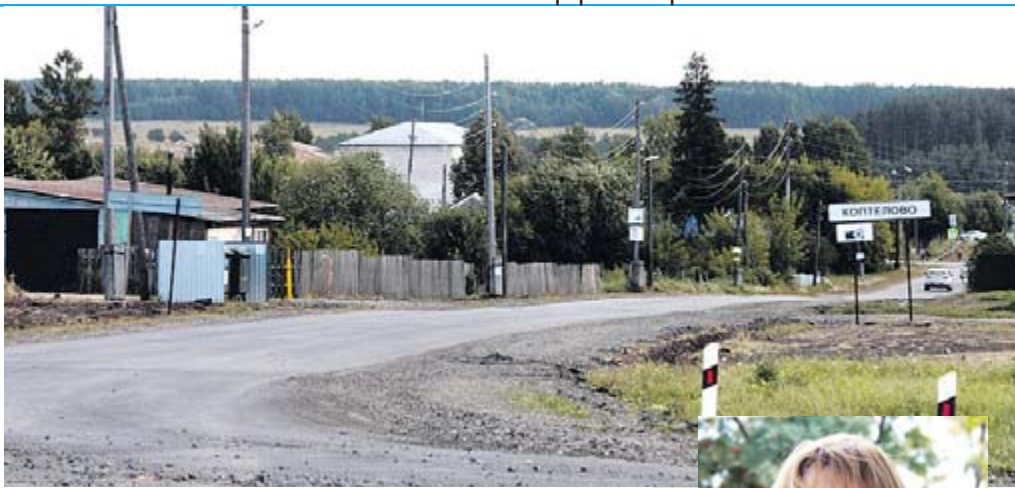
В этом году отремонтирована дорога на въезде в село