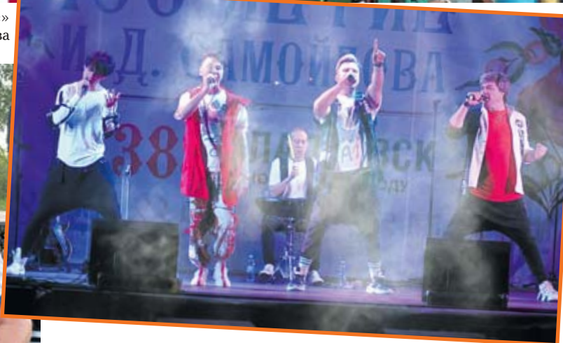
■ Московские гости — группа «НА-НА»