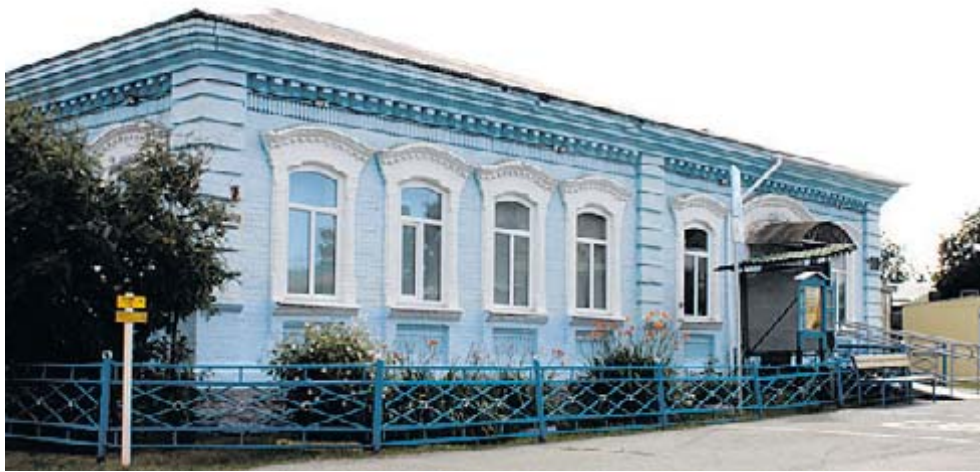
Гордость села – музей