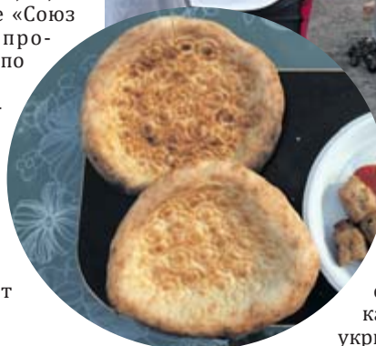
Лепёшки из тандыра

хлебного изделия, вернее даже не рецепт, а список ингредиентов – до 5-6 наименований. А кроме того, необходимы дрова для розжига печи. Где всё это можно взять?