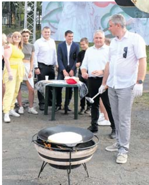
Команда «Колобок» печёт лаваш на садже