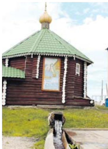
Знаменитый коптеловский родник даёт свежую студёную воду круглый год