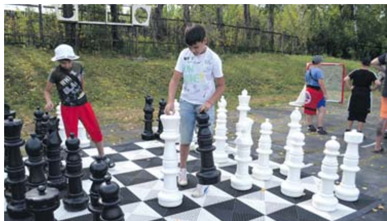
Кому мало настольных масштабов...