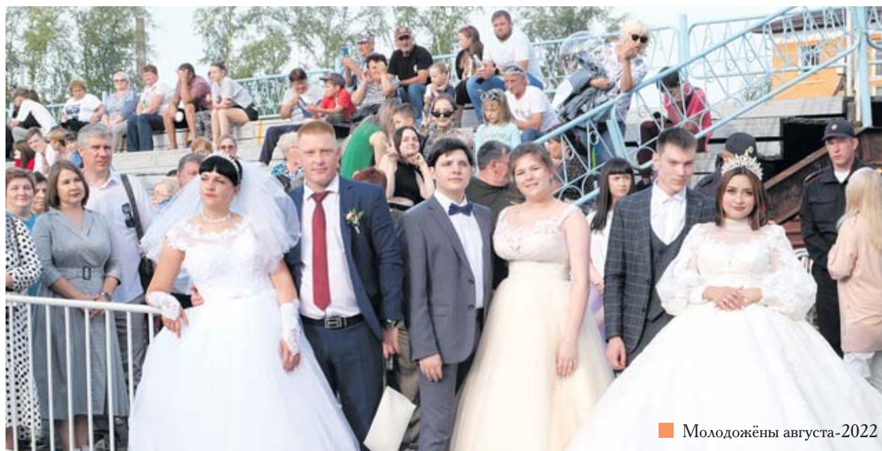
■ Молодожёны августа-2022