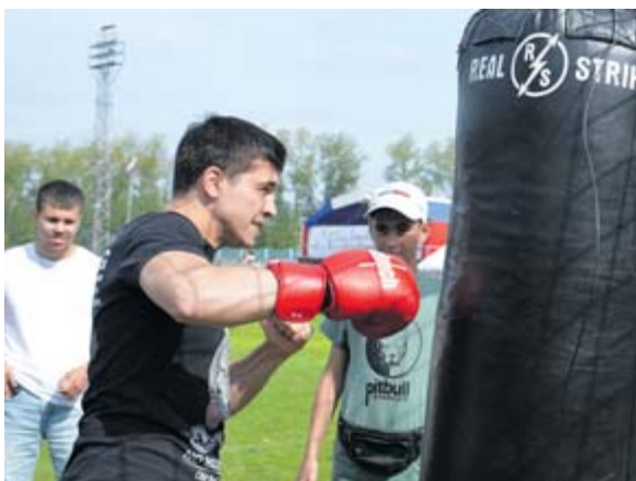
Конкурс «Кто самый сильный»