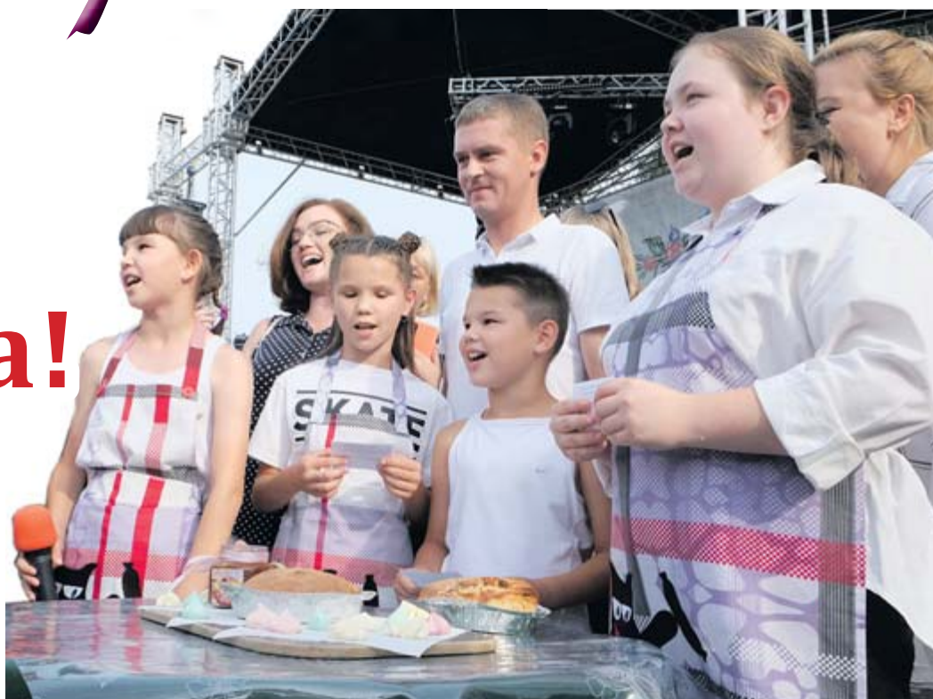
Пшеничный хлеб команды «Буханка» — победительницы шоу

Впервые в Алапаевске на традиционном празднике «День города» при полном аншлаге состоялось настоящее кулинарное шоу «Хлеб – всему голова». В выпекании национальных разновидностей хлеба состязались самые смелые, ведь стряпать надо на виду у всего города!