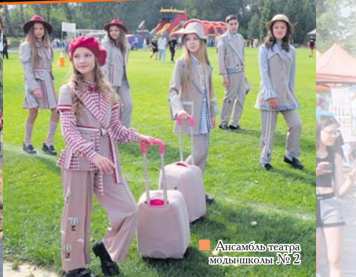
■ Ансамбль театра моды школы № 2