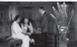
02:40 «Импровизация» (16+)

07:00, 10:00 «Однажды в России. Спецдайджест» (16+) 09:00 «Звездная кухня» (16+) 09:30 «Перезагрузка» (16+) 14:50 X/ф «Мальчишник в Вегасе» (18+) 16:50 X/ф «Мальчишник. Часть II» (16+) 19:00 «Новая битва экстрасенсов» (16+) 21:00 «Новые танцы» Шоу (16+) 23:00 «Женский Стендап» (16+) 00:00 «Битва экстрасенсов» (16+)