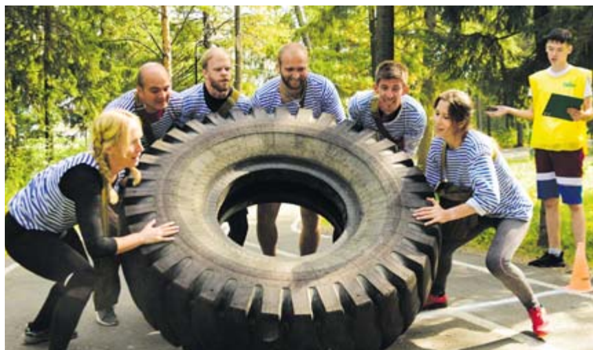
Команда Артёмовского на втором этапе