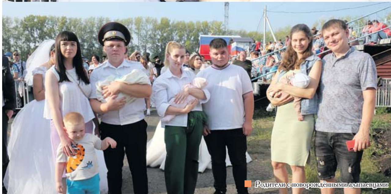
■ Родители с новорождёнными алапаевцами