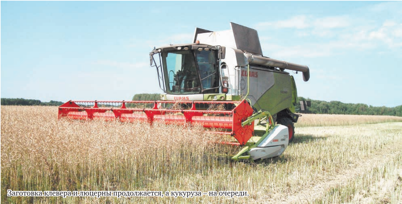
Заготовка клевера и люцерны продолжается, а кукуруза – на очереди.

И на этом фоне – оборотная сторона нынешнего, повсеместно высокого урожая: падение закупочных цен на сельхозпродукцию, в частности на зерновые: пшеницы, ячменя – с 18-19 до 9-10 рублей, овса – с 15 до 6-7.