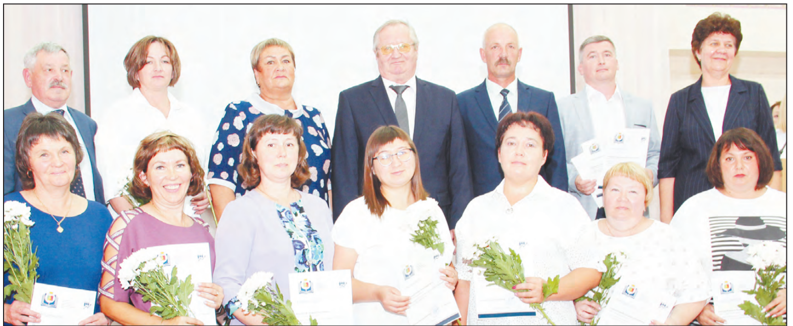
Хозяева и гости конференции

Новый ФГОС делает акцент на тесном взаимодействии и единстве учебной и воспитательной деятельности в достижении личностных результатов освоения программы. Уточнены направления воспитания: гражданско-патриотическое, духовно-нравственное, эстетическое,