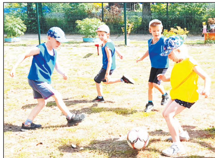
Победу принесла Виктория!

Владимир ФЕФЕЛОВ, внештатный корреспондент