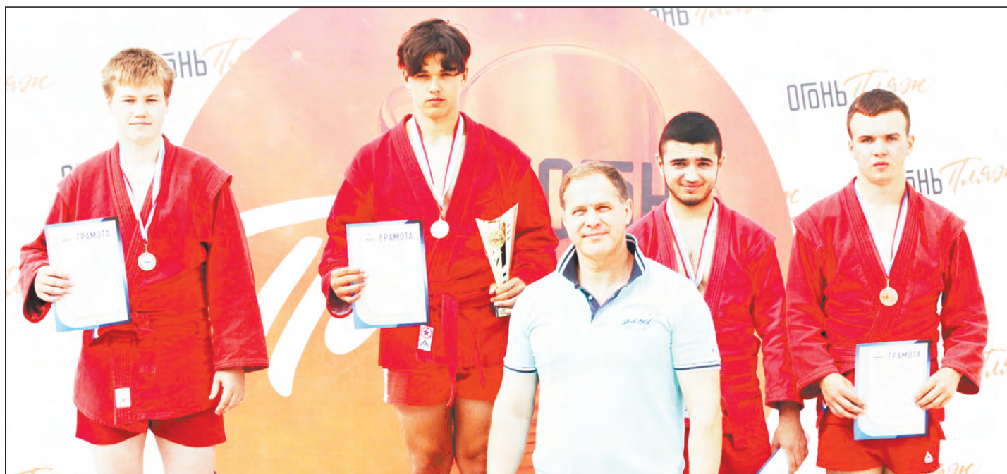
Пьедестал весь ваш!