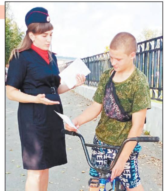
все правильно сделал!