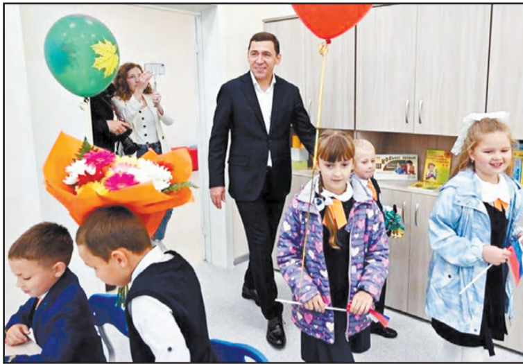
В школе №55