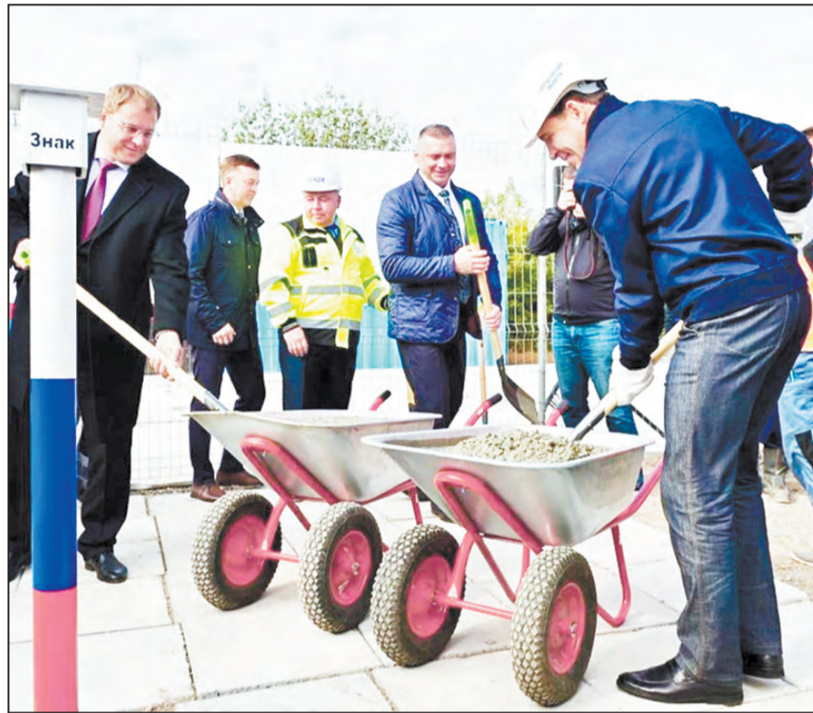
Закладка камня как начало строительства

Губернатор Свердловской области Евгений Куйвашев дал старт строительству важного моста на трассе Екатеринбург-Тюмень 6 сентября в ходе рабочей поездки в городской округ Богданович. Путепровод через мощный железнодорожный узел соединит северную и южную части города, навсегда избавив местных жителей и транзитный транспорт от многочисленных пробок.