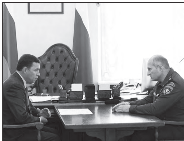
Е. Куйвашев и А. Куренков

Глава МЧС России Александр Куренков высоко оценил готовность Свердловской области к оперативному реагированию на чрезвычайные ситуации. Об этом министр заявил 2 сентября в ходе рабочей встречи с губернатором Евгением Куйвашевым.