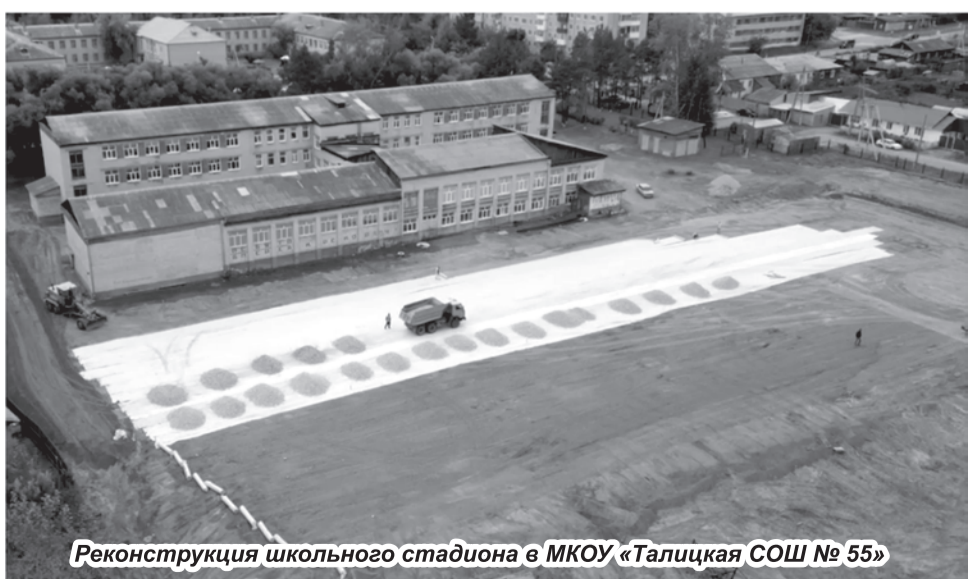
Реконструкция школьного стадиона в МКОУ «Талицкая СОШ № 55»