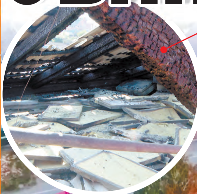
крыша после пожара