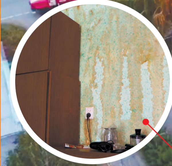
последствия пожара в квартирах жильцов